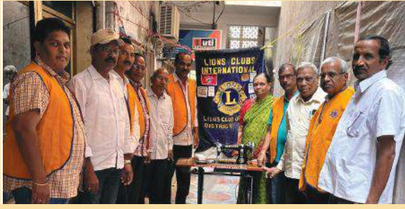
ఖమ్మం సూర్య ప్రతినిధి