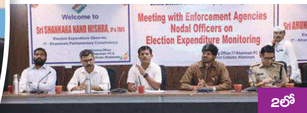
ఎన్నికల్లో పోటీ చేసే అభ్యర్థులు నామినేషన్ వేసిన నాటినుండి ఎన్నికల ప్రక్రియ ముగిసే వరకు ఎన్నికల ఖర్చు వివరాలను నమోదు చేయాలి