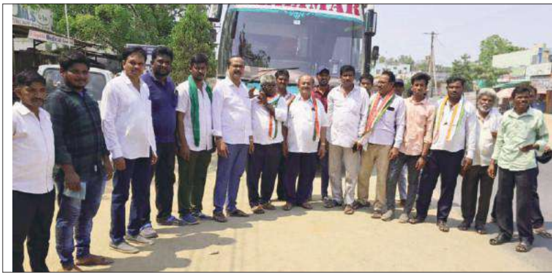
అశ్వాపూరం, సూర్య (మేజర్ న్యూస్) - రానున్న పార్లమెంట్ ఎన్నికల్లో మహబూబాబాద్ పార్లమెంటు నియోజకవర్గం నుండి పోటీ చేస్తున్న కాంగ్రెస్ పార్టీ బలపరిచిన అభ్యర్థి కేంద్ర మాజీ మంత్రి పోరిక బలరాం నాయక్ నామినేషన్ దాఖలు చేస్తున్న సందర్భంగా అశ్వాపూరం మండల