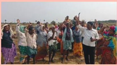
సత్తుపల్లి, సూర్య టౌన్ స్యూస్ దేశంలో సరేంద్ర మోడీ ప్రభుత్వం అవలంబిస్తున్న కార్యక్రమ వ్యతిరేక ప్రజావ్యతిరేక