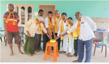
కల్లూరు, సూర్య మేజర్