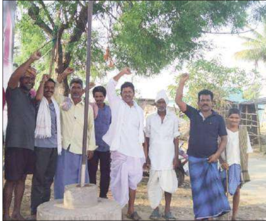
లేని సమాజం సాధన కోసం నూతన ప్రజాస్వామిక విప్లవమే లక్ష్యంగా సిపిఐ(ఎం-ఎల్) ఆవిర్భ