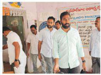
వైరా. ఏనుకూరు సూర్య