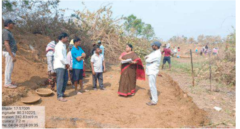
Altitude: 17.57006 Longitude: 80.310225 Elevation: 242.83±69 m Accuracy: 7.2 m Time: 04-04-2024 09:35