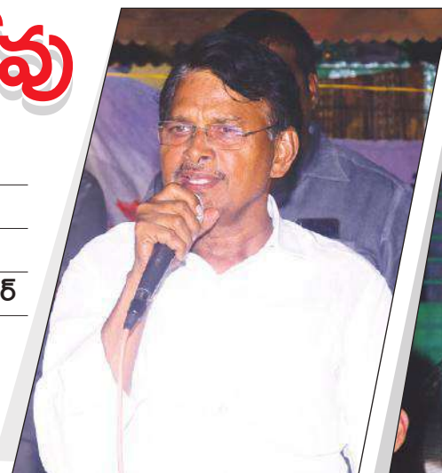
టింజేవారన్నారు. రాష్ట్ర ముఖ్యమంత్రి జగన్మోహన్ రెడ్డి తీసుకువచ్చిన ఆర్.బి.కెలు, మిగతా 2లో