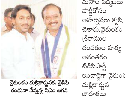
వైకుంఠం మల్లికార్జునకు వైసీపీ కందువా వేస్తున్న సిఎం జగన్

చేరారు. వారికి వైఎస్ జగన్ వైసీపీ కందువాలు కప్పి పార్టీలోకి ఆహ్వానించారు. పార్టీకోసం పనిచేయాలని పార్టీ అధికారంలోకి వస్తే అందరికీ గుర్తింపు ఉంటుందని తెలిపారు. టీడీపీ రాష్ట్ర కార్యదర్శిగా, మాజీ ఇంచార్జి పనిచేసిన వైకుంఠం మల్లికార్జున, మాజీ ఎంపీల