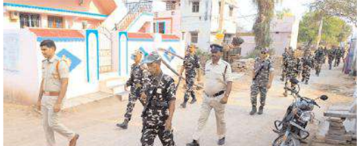
పోలీసు కవాతు నిర్వహిస్తున్న దృశ్యం