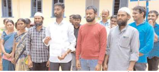
రాజీనామా పత్రాన్ని మామిడుతున్న పార్వపల్లె వాలంటీర్లు