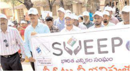
స్వీప్ అండ్ ఎలెక్ట్ కార్యక్రమం