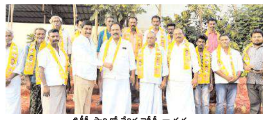
టిడిపీ పార్టీలో చేరిన వైసీపీ నాయకులు