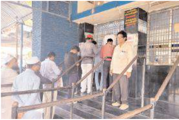
విద్యార్థులు చేసిన ప్రత్యేక కౌంటర్లు