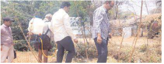
మందు పిబికారి చేయిస్తున్న దృశ్యం