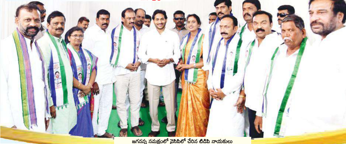
జగన్ నన్న సమక్షంలో వైసీపీలో చేరిన టిడిపి నాయకులు