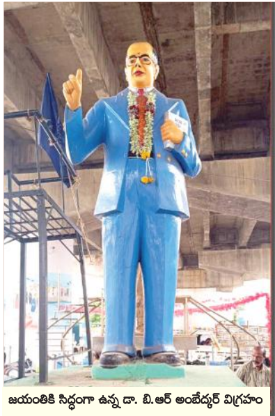
జయంతికి సిద్ధంగా ఉన్న డా. బి.ఆర్ అంబేద్కర్ విగ్రహం