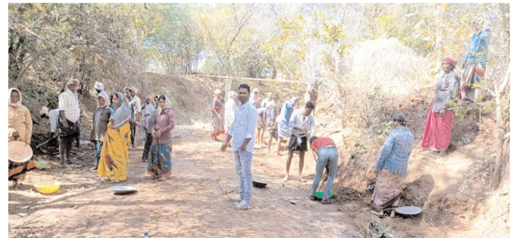
ఉపాధి పనులను పరిశీలిస్తున్న ఏపీఓ రాజనాయక్ (ఫైల్ ఫోటో)