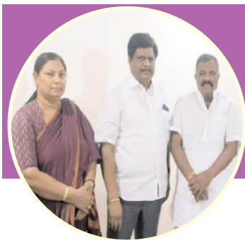
కోడుమూరు, మేజర్ న్యూస్: నామినేషన్ల సమయం ముంచుకొస్తున్నా కోడుమూరు నియోజకవర్గంలో కోట్ల వర్గీయులు