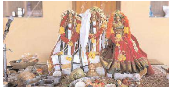
కాకనూరులో రాముల వారి కళ్యాణం నిర్వహించిన దృశ్యం