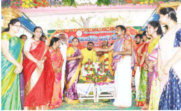
మిగతా 3లో | రాంబొట్ల దేవాలయంలో సీతారాముల కళ్యాణోత్సవం