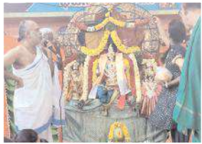
సీతారాముల కళ్యాణం నిర్వహిస్తున్న దృశ్యం