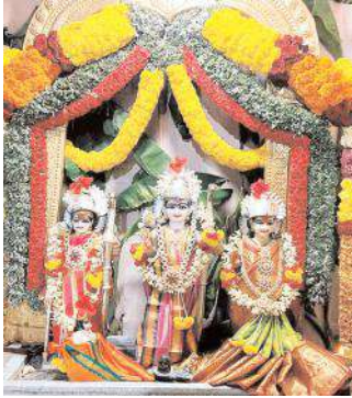
శ్రీబాలాజీ కాంప్లెక్స్ లో ముస్తాబైన శ్రీసీతాసమేత రాముల వారు

పితృవాఖ్య పరిపాలకుడు శ్రీరాముడు కల్యాణోత్సవం చేస్తే సకల ఘటాలు కలుగుతాయని రామాయణం చెబుతుంది. చైత్రశుద్ధ నవమినాడు పునర్వసు నక్షత్రంలో కర్కాటక లగ్నంలో మధ్యాహ్నం 12గంటలకు అభిజిత్ ముహూర్తంలో శ్రీరామచంద్రమూర్తి దశరథుని కుమారునిగా జన్మించినట్లు వాల్మీకి రామాయణం మనకు తెలుపుతున్నది. అందువల్ల ఈ పుణ్యదినమే మనం అనాదిగా శ్రీరామనవమి పండుగగా జరుపుకుంటున్నాం. ఆయన కల్యాణమంటే అది లోక కల్యాణకారకం. శ్రీరాముని శాసనం భూమండలం అంతటా వ్యాపించి ఉన్నందున ఆయనను మనం సార్వభౌమునిగా అభిషేకిస్తాం, ఆరాధిస్తాం ఆయన సకల చరాచర జగత్తును పాలిస్తూ సర్వదా నివసించిన అద్వితీయుడు శ్రీరాముడు. బుధవారం పట్టణంలోని శ్రీరాముడి ఆలయాలను అత్యంత సుందరంగా ముస్తాబు చేశారు. రాములోరి కల్యాణం చూడడానికి భక్తజనం కల్యాణం జరిగే ఆలయాలకు వెళ్లి వీక్షించారు. తమ ఇళ్ళల్లో శ్రీసీతా సమేత రాముల వారి పటంకు పూజాదికాలు చేసి వడపప్పు, పెసరపప్పు, పానకం నైవేద్యంగా సమర్పించారు. సంజీవనగర్ రామాలయం