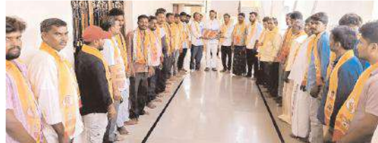
టీడీపీలో చేరిన వైసీపీ నాయకులు