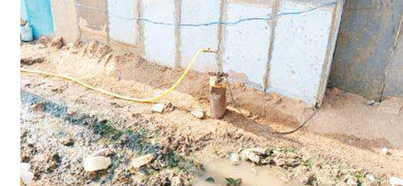
ముచ్చిగిలో కబ్బాకు గురైన మంచినీటి బోరు

బోరును కబ్బాచేసిన వారిపై చర్యలు తీసుకోవాలని అలాగే మంచినీటి బోరు ప్రజలకు ఉపయోగపడే విధంగా ఉండేట్లు చూడాలని గ్రామస్థులు అధికారుల నుకోరుతున్నారు.