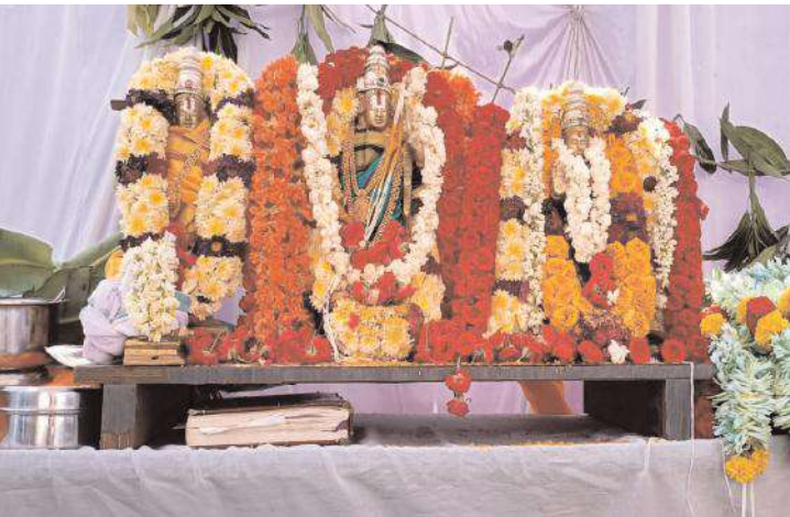
పూజలందుకున్న సీతారామ, లక్ష్మణ స్వామివార్లు

కౌతాళం, మేజర్ న్యూస్: శ్రీరామనవమి సందర్భంగా బుధవారం సీతారాముల కళ్యాణోత్సవం కమనీయం.. రమణీయంగా జరిగింది. సీతారాములు ఒక్కటైన వేళ ప్రజలందరూ అంక్షితలు వేసి సీతారాములను దర్శించుకున్నారు. మండలకేంద్రమైన కౌతాళంలోని శివాలయంలో శ్రీరామనవమి సందర్భంగా సీతారామచంద్రస్వామి వారి కళ్యాణ మహోత్సవం విశ్వహిందూ పరిషత్ భజరంగదర్, ఆర్ఎస్ఎస్, గ్రామ ప్రజలు, పెద్దలు, ప్రముఖుల ఆధ్వర్యంలో ఘనంగా నిర్వహించారు. దేవస్థానానికి అనుబంధ ఆలయమైన ప్రసన్నాంజనేయస్వామి ఆలయంలో ఉదయం నుంచి సీతారామస్వామికి, ఆంజనేయస్వామికి విశేష పూజలు నిర్వహించారు. పూజలనంతరం సీతారాముల కళ్యాణం కన్నుల పండువగా నిర్వహించారు. కళ్యాణోత్సవానికి ముందుగా లోక కళ్యాణాన్ని ఆకాంక్షిస్తూ సంకల్పం పాటించి కళ్యాణోత్సవ కార్యక్రమం నిర్విఘ్నంగా జరగాలని మహాగణపతికి పూజ, వృద్ధి అభ్యుదయాలను ఆకాంక్షిస్తూ పుణ్యహవచనం, కంకణపూజ, యజ్ఞోపవీత పూజ, నూతన వస్త్ర నమస్కరణ, వరపూజ, ప్రవర పఠనం, మాంగల్యపూజ, సీతాదేవికి మాంగల్యధారణ, తలంబ్రాలు, మొదలైన కార్యక్రమాలతో శాస్త్రోక్తంగా సాంప్రదాయబద్ధంగా కళ్యాణం నిర్వహించారు. సీతారాముల కళ్యాణోత్సవాన్ని ఎంతో భక్తిశ్రద్ధలతో భక్తాదులు తిలకించారు. అనంతరం దేవస్థాన నిర్వాహకులు భక్తులకు తీర్థ ప్రసాదాలను అందజేశారు.