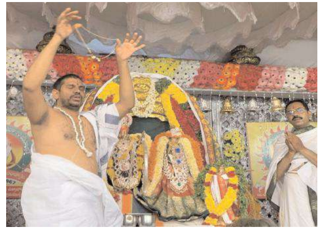
వివాహ సుమూహార్యం కావడంతో తాళికట్టే దృశ్యం