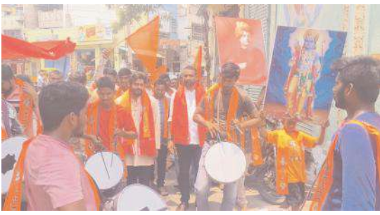
ఉత్పవార్లో పాల్గొన్న జనసేన నాయకులు