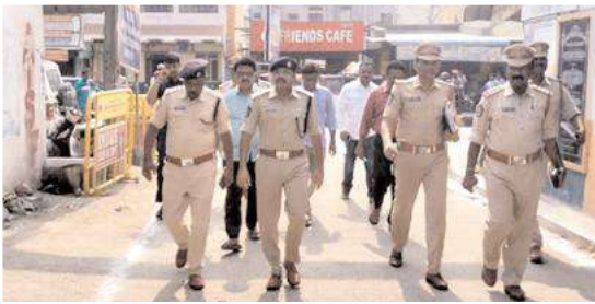
పోలింగ్ కేంద్రాలను తనిఖీ చేస్తున్న జిల్లా ఎస్పీ