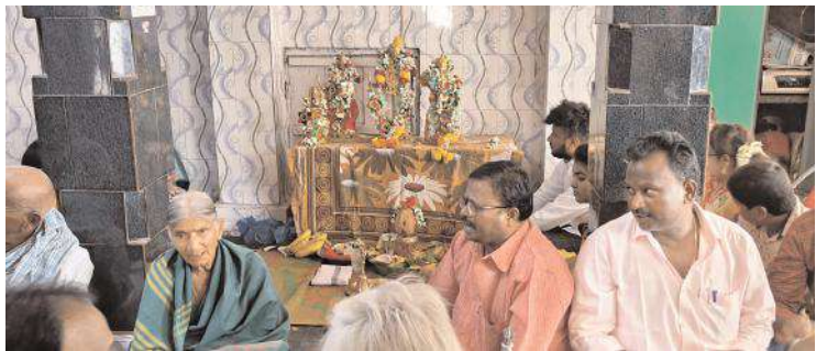
సీతారాముల కళ్యాణోత్సవంలో పాల్గొన్న భక్తులు