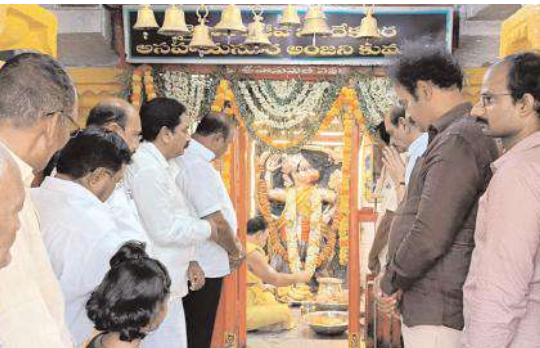
పూజలు నిర్వహిస్తున్న దృశ్యం