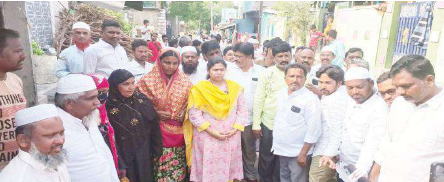
కోటగడ్డ కాలనీలో ఇంటింటి ప్రచారం నిర్వహిస్తున్న మాజీమంత్రి