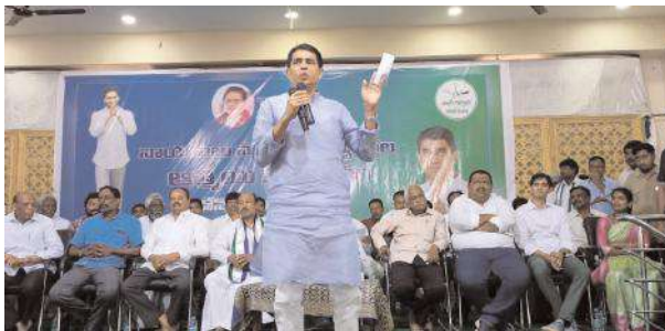
మాట్లాడుతున్న ఆర్థిక మంత్రి బుగ్గన

2014, 2019 ఎన్నికల్లో నియోజకవర్గ ప్రజలు నాపై నమ్మకంతో గెలిపిస్తే ఇచ్చిన హామీ మేరకు డోన్ నియోజకవర్గాన్ని మోడల్ నియోజకవర్గంగా