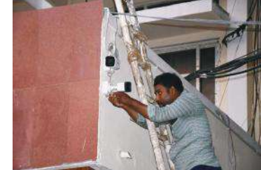
సీసీ కెమెరాలను ఏర్పాటు చేస్తున్న దృశ్యం

సమస్యలుంటే వాటిని పరిష్కరించేందుకు హెల్ప్ డెస్కులను ఏర్పాటు చేశారు. కలెక్టరేట్, మున్సిపల్ కార్యాలయాల్లో నామినేషన్ స్వీక