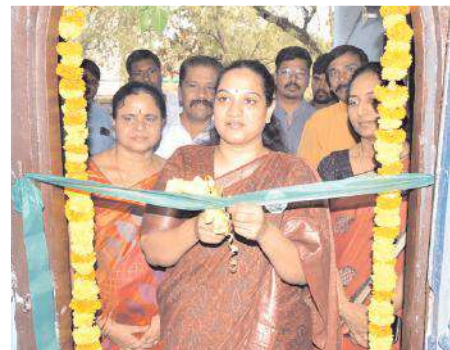
మీడియా సెంటర్ను ప్రారంభిస్తున్న దృశ్యం

ఏర్పాటు చేయడం జరుగుతుందన్నారు. ఈవీఎలు, కమిషనింగ్ చేసుకోవడం, పీవో, ఏపీవోలకు మరోసారి శిక్షణ తరగతులను నిర్వహించడం లాంటి కార్యక్రమాలను ప్రణాళిక రూపొందించుకోవడం జరిగిందన్నారు. పోలింగ్ శాతాన్ని గతంలో కంటే ఎక్కువగా తీసుకవచ్చేందుకు స్పీష్ కార్యక్రమాలను నిర్వహిస్తున్నామన్నారు. సివిజిల్ ఫిర్యాదులను నిర్ణీత సమయంలో పరిష్కరించడంలో గతంలో జిల్లా యావరీజ్ 64శాతం ఉండేదని, ఇప్పుడు 89శాతానికి పురోగతి తీసుకరావడం జరిగిందన్నారు. ఎండతీవ్రత ఎక్కువగా ఉన్నందున పోలింగ్ కేంద్రాల్లో ఓటర్లకు తాగునీరు, షేడ్,