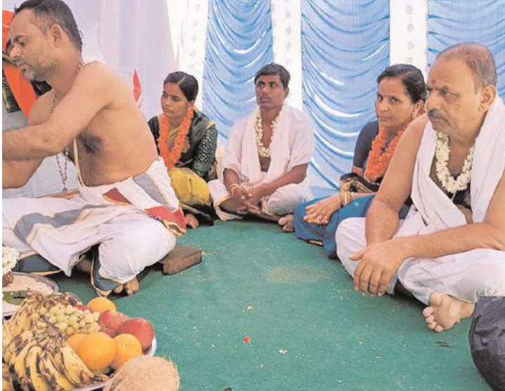
సీతారాములకు కళ్యాణ మహోత్సవాన్ని నిర్వహిస్తున్న పురోహితులు, భక్తులు

కౌతాళం, మేజర్ న్యూస్: శ్రీరామనవమి సందర్భంగా బుధవారం సీతారాముల కళ్యాణోత్సవం కమనీయం.. రమణీయంగా జరిగింది. సీతారాములు ఒక్కటైన వేళ ప్రజలందరూ అంక్షితలు వేసి సీతారాములను దర్శించుకున్నారు. మండలకేంద్రమైన కౌతాళంలోని శివాలయంలో శ్రీరామనవమి సందర్భంగా సీతారామచంద్రస్వామి వారి కళ్యాణ మహోత్సవం విశ్వహిందూ పరిషత్ భజరంగదర్, ఆర్ఎస్ఎస్, గ్రామ ప్రజలు, పెద్దలు, ప్రముఖుల ఆధ్వర్యంలో ఘనంగా నిర్వహించారు. దేవస్థానానికి అనుబంధ ఆలయమైన ప్రసన్నాంజనేయస్వామి ఆలయంలో ఉదయం నుంచి సీతారామస్వామికి, ఆంజనేయస్వామికి విశేష పూజలు నిర్వహించారు. పూజలనంతరం సీతారాముల కళ్యాణం కన్నుల పండువగా నిర్వహించారు. కళ్యాణోత్సవానికి ముందుగా లోక కళ్యాణాన్ని ఆకాంక్షిస్తూ సంకల్పం పాటించి కళ్యాణోత్సవ కార్యక్రమం నిర్విఘ్నంగా జరగాలని మహాగణపతికి పూజ, వృద్ధి అభ్యుదయాలను ఆకాంక్షిస్తూ పుణ్యహవచనం, కంకణపూజ, యజ్ఞోపవీత పూజ, నూతన వస్త్ర నమస్కరణ, వరపూజ, ప్రవర పఠనం, మాంగల్యపూజ, సీతాదేవికి మాంగల్యధారణ, తలంబ్రాలు, మొదలైన కార్యక్రమాలతో శాస్త్రోక్తంగా సాంప్రదాయబద్ధంగా కళ్యాణం నిర్వహించారు. సీతారాముల కళ్యాణోత్సవాన్ని ఎంతో భక్తిశ్రద్ధలతో భక్తాదులు తిలకించారు. అనంతరం దేవస్థాన నిర్వాహకులు భక్తులకు తీర్థ ప్రసాదాలను అందజేశారు.