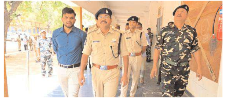
ఈవిఎం స్ట్రాంగ్ రూంలను పరిశీలిస్తున్న జిల్లా ఎస్పీ