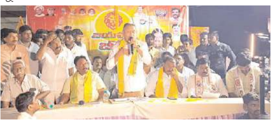
జయహో బీసీ కార్యక్రమంలో పాల్గొన్న తెదేపా నాయకులు