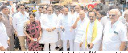
చంద్రబాబు పర్యటనకు స్థల ఏర్పాట్లను పరిశీలిస్తున్న టీడీపీ జిల్లా నాయకులు