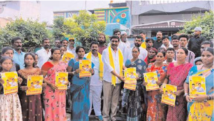
కరపత్రాలను పంపిణీ చేస్తున్న దృశ్యం