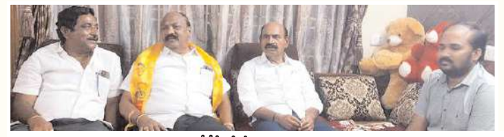
టీడీపీలో చేరిన సుదర్శనం

- పార్టీ విధి విధానాలు నచ్చక పార్టీ మార్పు