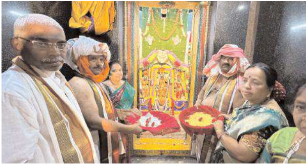
మూలవిరాట్లకు పట్టువస్త్రాలను సమర్పిస్తున్న ఆలయ నిర్వాహకులు

- అంగరంగ వైభవంగా శ్రీరాములోరి వివాహ మహోత్సవం - ఆలయాల్లో ముస్తాబైన శ్రీసీతాసమేత రామ లక్ష్మణులు