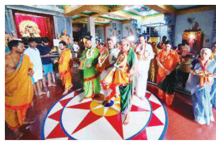
సూర్యనారాయణ దేవాలయంలో కళ్యాణోత్సవ దృశ్యం