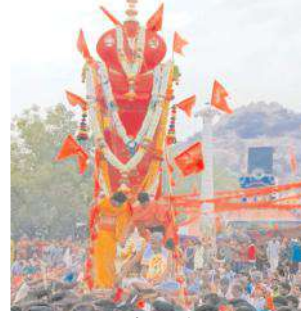
సుశవాయిలో ఆంజనేయస్వామి రథోత్సవాన్ని నిర్వహిస్తున్న భక్తులు

★ కన్నుల పండువగా సీతారాముల కల్యాణోత్సవం హాళగుండ, మేజర్ న్యూస్ : శ్రీరామనవమి సందర్భంగా మండల పరిధిలోని సుశవాయి గ్రామంలో బుధవారం సాయంత్రం ఆంజనేయస్వామి రథోత్సవ కార్యక్రమాన్ని భక్తులు వైభవంగా నిర్వహించారు. ఆంజనేయస్వామికి భక్తులు విశేషంగా పూజలు నిర్వహించి మోక్షబుడులు తీర్చుకున్నారు. సాయంత్రం భక్తులను మధ్య రథోత్సవాన్ని నిర్వహించారు. అదేవిధంగా