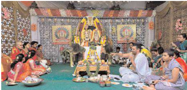
సంజీవనగర్ రామాలయంలో శ్రీరాములోరి వివాహతంతు జరుగుతున్న దృశ్యం