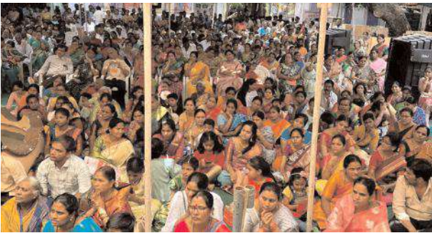
వివాహ వేడుకలకు హాజరైన భక్తులు