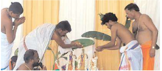
సీతారాముల కళ్యాణోత్సవం నిర్వహిస్తున్న అర్చకులు