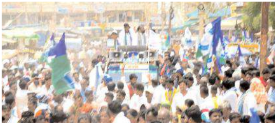
ప్రచారంలో వైసీపీ ఇంచార్జ్ విరుపాక్షి