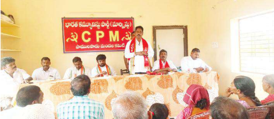
సమావేశంలో మాట్లాడుతున్న ఎమ్మెల్యే ఆర్థర్