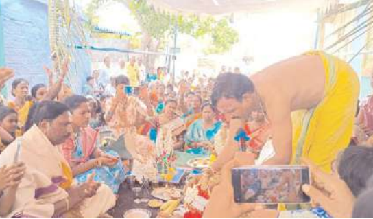
కళ్యాణం నిర్వహిస్తున్న గ్రామస్థులు