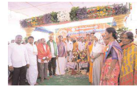
కళ్యాణోత్సవంలో పాల్గొన్న రాజకీయ ప్రముఖులు