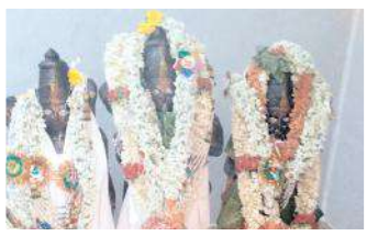
శ్రీరామ్ నగర్ క్యాంఫ్ లో స్వామి వార్లకు విశేషంగా పూజలు చేసిన దృశ్యం

స్థానిక శ్రీరామ నగర్ క్యాంఫ్, హోస్పూర్ క్యాంఫ్ లో సీతారాములకు కల్యాణోత్సవ కార్యక్రమం కన్నుల పండువగా నిర్వహించారు. భక్తులు అధిక సంఖ్యలో హాజరయ్యారు. సీతారామ, లక్ష్మణ, ఆంజనేయస్వామి వార్లకు పూజలు చేశారు. జై శ్రీరామ్ అంటూ నినాదాలు చేస్తూ భక్తులు దైవ దర్శనం చేసుకున్నారు. వచ్చిన భక్తులకు తీర్థప్రసాదాలతో పాటు అన్నప్రసాదం ఏర్పాటు చేశారు. దేవాలయాల్లో భక్తుల సందడి నెలకొంది.