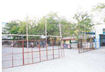
ఏర్పాటు చేసిన బారికేడ్లు