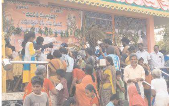
పెద్దదేవాలపురంలో పాణకం, వడపప్పు పంతుతున్న దృశ్యం