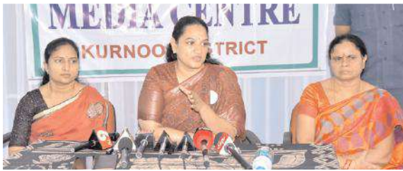
మీడియాతో మాట్లాడుతున్న కలెక్టర్

రావాలని, 3.00గంటల తర్వాత క్యూ లైన్ లో ఉండే వారికి టోకెన్లు ఇచ్చి వారి నుంచి నామినేషన్ స్వీకరిస్తామన్నారు. మధ్యాహ్నం 3గంటల తర్వాత వస్తే నామినేషన్ స్వీకరించమన్నారు. నామినేషన్ స్వీకరించే ప్రక్రియ పూర్తయిన తర్వాత ఏప్రిల్ 26వతేదీన అబ్జర్వర్స్ అభ్యర్థ్యంలో సంబంధిత రిటర్నింగ్ అధికారులు నామినేషన్లను స్కూటీని చేయడం జరుగుతుందన్నారు. నామినేషన్ ఉపసంహరణ 29వతేదీన ఉంటుందన్నారు. నామినేషన్ ఉపసంహరణ పూర్తయిన తర్వాత ప్రింటింగ్ చేయించడం, పోస్టల్ బ్యాలెట్ ఫెసిలిటీషన్ సెంటర్