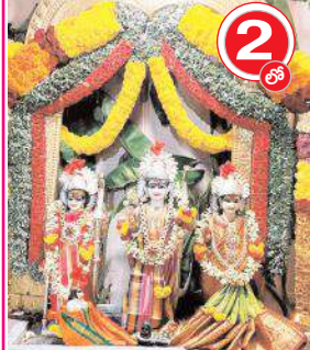
శ్రీబాలాజీ కాంప్లెక్స్లో ముస్తాబైన శ్రీసీతాసమేత రాముల వారు