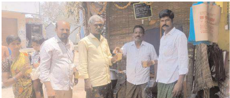
ప్రజలకు పానకాన్ని పంపిణీ చేస్తున్న ఆర్యవైశ్య సంఘం అధ్యక్షుడు