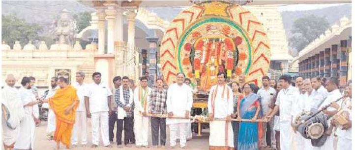
స్వామివార్ల కళ్యాణ మహోత్సవ దృశ్యం