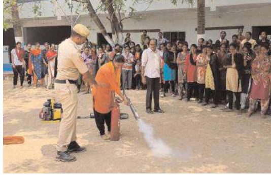
అగ్ని ప్రమాదాలపై అవగాహన కల్పిస్తున్న దృశ్యం