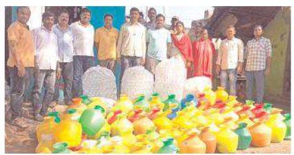
నాటుసారాను ధ్వంసం చేస్తున్న దృశ్యం