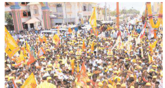
నామినేషన్ చేస్తున్న టీడీపీ అభ్యర్థి