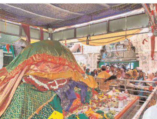
ఎల్లార్ల శేక్సావలితాత్ దర్గా

హాళగుండ, మేజర్ న్యూస్: హాళగుండ మండలం ఎల్లార్ల గ్రామంలో కొలువైన హజరత్ శేక్సావలితాత్, హజరత్ షాహిపలితాత్ దర్గాల నుండి రూ.కోట్లలో ఆదాయం