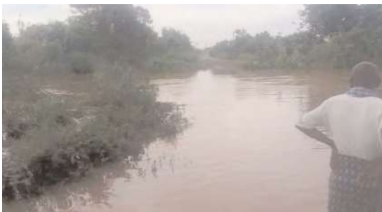
జీసీపాలెం దగ్గర ఉన్న వాగు పాత చిత్రం