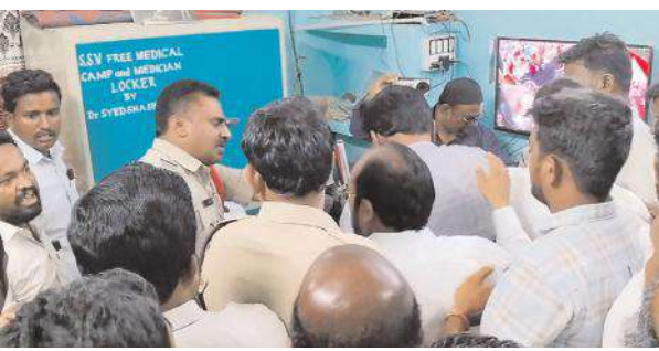
వక్సీబోర్డు అధికారుల, పోలీసుల సమీక్షంలో వివాదానికి దిగిన ఇరువర్గాల వారు

హాళగుండ, మేజర్ న్యూస్: హాళగుండ మండలం ఎల్లార్ల గ్రామంలో కొలువైన హజరత్ శేక్సావలితాత్, హజరత్ షాహిపలితాత్ దర్గాల నుండి రూ.కోట్లలో ఆదాయం