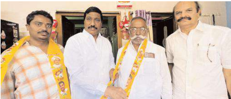
టీడీపీలోకి చేరుతున్న మద్దలేటి గౌడ్