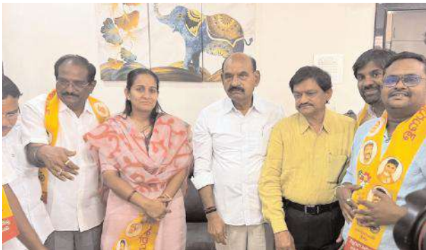
టీడీపీలో చేరిన దండే కుటుంబం