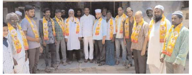
టీడీపీ పార్టీలో చేరిన వైసీపీ వర్గయులు