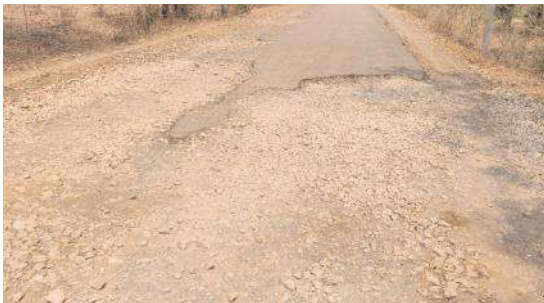
పార్టీ కాని ఓంకార క్షేత్ర రహదారి పనులు