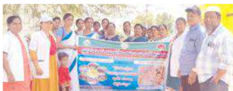
ర్యాలీ నిర్వహిస్తున్న దృశ్యం

తుగ్గలి, మేజర్ న్యూస్: మండల కేంద్రమైన తుగ్గలిలో గురువారం తుగ్గలి ప్రాథమిక ఆరోగ్య కేంద్రం సిబ్బంది ప్రపంచ మలేరియా దినోత్సవంపై ర్యాలీ నిర్వహించారు. ర్యాలీ అనంతరం ఆరోగ్య కేంద్రంలో జరిగిన కార్యక్రమంలో కమ్యూనిటీ హెల్త్ ఆఫీసర్