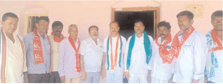
సమావేశంలో మాట్లాడుతున్న ఇండియా కూటమి సభ్యులు