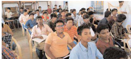
పాలిసెట్ కు శిక్షణ పొందుతున్న విద్యార్థులు

కళాశాలల్లో ప్రవేశం కొరకు నిర్వహించే పాలిసెట్ పరీక్షను సాంకేతిక విద్యాశాఖ నిర్వహిస్తున్నదని పాలిసెట్ శిక్షణను నంద్యాల ప్రభుత్వ పాలిటెక్నిక్ కళాశాలలో ఉచితంగా శిక్షణ ఇస్తున్నట్లు తెలిపారు. జిల్లాలోని నంద్యాల, బేతంచెర్ల, శ్రీశైలం పాలిటెక్నిక్ ఆధ్వర్యంలో 18 పరీక్షా కేంద్రాలలో ప్రవేశ పరీక్ష నిర్వహిస్తున్నట్లు తెలిపారు. పరీక్షా కేంద్రాలలో ఉదయం 11 గంటల నుంచి మధ్యాహ్నం 1 గంట వరకు పరీక్ష జరుగుతుందని తెలిపారు. ఒక గంట ముందుగా ఆయా పరీక్ష కేంద్రానికి చేరుకోవాలని హాల్ టిక్కెట్లు డౌన్ లోడ్ చేసుకోవడంలో ఇతర సందేహాలకై హెల్ప్ లైన్ సెంటర్ ను సంప్రదించాలని తెలిపారు. నంద్యాలలో 12 పరీక్షా కేంద్రాలలో 4173 మంది హాజరవుతున్నారని తెలిపారు. పాలిటెక్నిక్ కళాశాలలో నిర్వహించిన శిక్షణకు 391 మంది హాజరయ్యారని తెలిపారు.