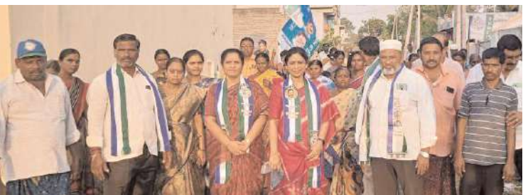
పార్లమెంటులో ప్రచారం నిర్వహించిన శిల్పా కుటుంబ మహిళలు

- పార్లమెంటులో ప్రచారం చేసిన శిల్పా కుటుంబ మహిళలు