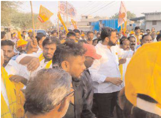
ప్రచారం నిర్వహిస్తున్న భూమా జగత్ విఖ్యాత్ రెడ్డి

అభ్యున్నతే తెలుగుదేశం పార్టీ లక్ష్యమని బిసీలకు 50 సంవత్సరాలకే 4వేలు ఫింబన్ అందిస్తామని బిసీలకు రక్షణ చట్టంలాంటి అనేక సంక్షేమ పథకాలను అమలు చేయనున్నట్లు ఆయన తెలిపారు. టీడీపీ అధికారంలోకి వస్తేనే ప్రతి వార్డు, గ్రామము అభివృద్ధి చెందుతాయని మహిళలకు మహాశక్తి పథకం ద్వారా పలు సంక్షేమ పథకాలు అమలు చేసేలా చంద్రబాబు మేనిఫెస్టో రూపొందించారని మహిళలకు ఆర్డీసీ బస్సు ఉచిత ప్రయాణంతోపాటు మూడు గ్యాస్ సిలిండర్లు కూడా అందిస్తారని ఆయన తెలిపారు. నిరుద్యోగులకు నిరుద్యోగ భృతి ఇస్తామని ఉద్యోగ అవకాశాలు రైతులకు గిట్టుబాటు ధర కల్పిస్తామని ఆయన అన్నారు. కావున రానున్న సార్వత్రిక