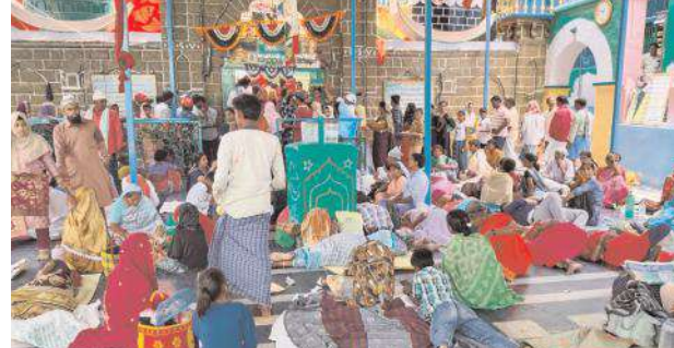
దర్గా ఆవరణలో నిద్రిస్తున్న భక్తులు