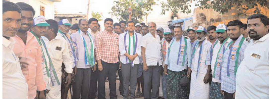
యువనేత సమక్షంలో వైకాపాలో చేరిన గ్రామ టీడీపీ నాయకులు