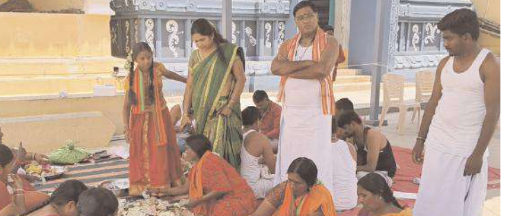
అమ్మవారి హుండీ లెక్కిస్తున్న దృశ్యం