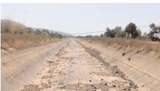
వెలవెలబోతున్న తెలుగుగంగ ప్రధాన కాలువ