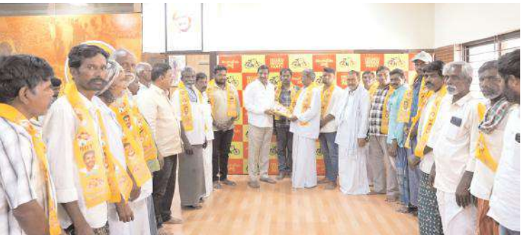
పార్టీలో చేరిన నాయకులతో మాజీ ఎమ్మెల్యే బీసీ