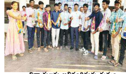
విద్యార్థులను అభినందిస్తున్న డ్యక్షం