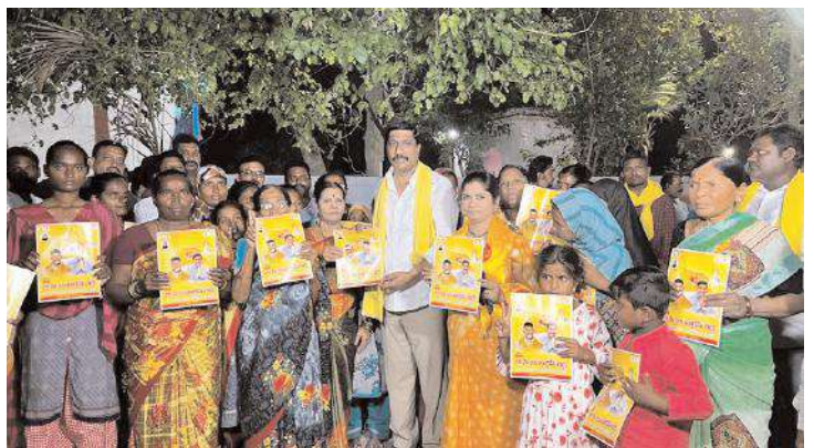
కరపత్రాలను పంపిణీ చేస్తున్న దృశ్యం