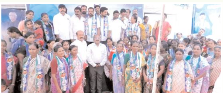
పార్టీలో చేరుతున్న దృశ్యం