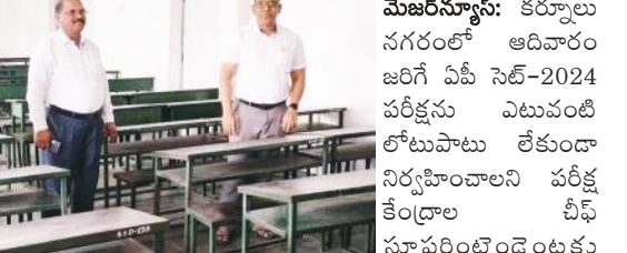
కర్నూలు స్టేట్స్, మేజర్ న్యూస్: కర్నూలు సగరంలో ఆదివారం జరిగి ఏపీ సెట్-2024 పరీక్షను ఎటువంటి లోటుపాటు లేకుండా నిర్వహించాలని పరీక్ష కేంద్రాల చీఫ్ సూపరింటెండెంట్లకు ఏపీ సెట్-2024 స్పెషల్