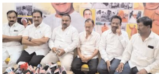
సమావేశంలో మాట్లాడుతున్న టీడీపీ లీగల్ సెల్ న్యాయవాది, టీడీపీ నాయకులు