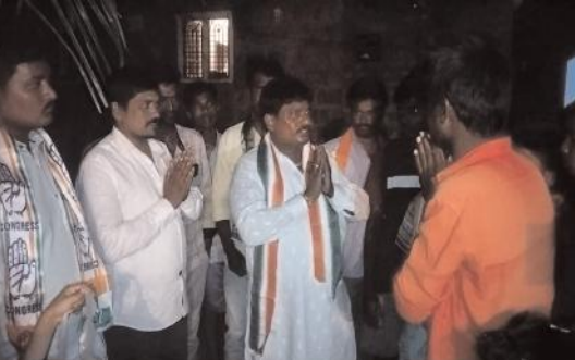
ఓటర్లకరు అభివాదం చేస్తున్న కాంగ్రెస్ అభ్యర్థి

అంతకుముందు గోనబావి గ్రామంలో ఎస్సీ కాలనీలో ఓటర్లను కలుసుకొని హస్తం గుర్తుకు ఓటియాలని కోరారు. ఆదోని నియోజకవర్గంలో కొన్ని దశాబ్దాలూగా ఇద్దరు వ్యక్తులే ఎమ్మెల్యేలుగా ప్రాతినిధ్యం వహిస్తూ, అభివృద్ధిని కుంటుపరుస్తున్నారని విమర్శించారు. తనను ఆశీర్వాదించి ఎన్నికల్లో గెలుపొందిస్తే పట్టణ, గ్రామాలను అభివృద్ధి చేస్తానని హామీ ఇచ్చారు. ఎన్నికల్లో ప్రజలను ప్రలోభాలు చేసి అధికారాన్ని చేజిక్కించుకునేందుకు ఓ వైపు వైఎస్సార్, ఎన్డీఏ కూటమి అభ్యర్థి ప్రజలకు మాయమాటలు