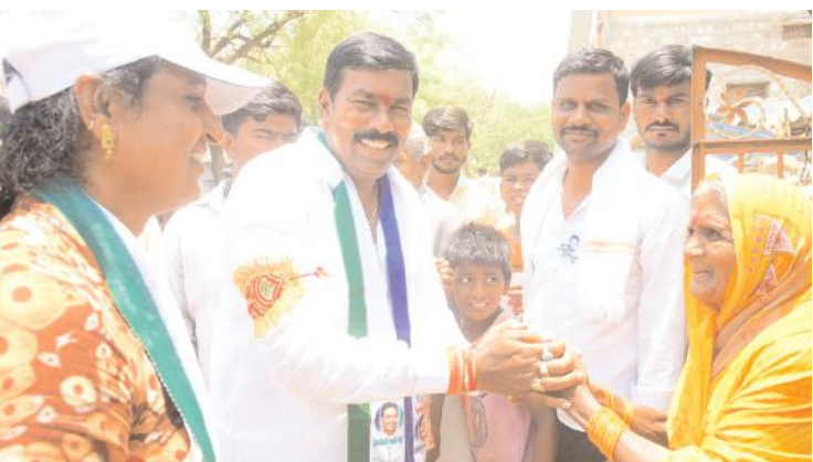
అవ్వా నీ ఓటు ఫ్యాన్ గుర్తుకే అంటున్న విరుపాక్షి