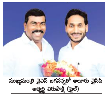
ముఖ్యమంత్రి వైఎస్ జగనన్నతో అలూరు వైసీపీ అభ్యర్థి విరుపాక్షి (పై)

స్థలాలు మంజూరు చేసినా ఏవైనా అనివార్య కారణాల వల్ల మిగిలిన వారికి ఇల్లు మంజూరు, పెన్షన్స్ 3వేల నుండి 3500కు పెంపు, కాపు నేస్తం 60వేల నుండి 1,20,000 పెంపు ఈబీసీ నేస్తం 45వేల నుండి 1,05,000 పెంపు, వైఎస్సార్ చేయూత 75 వేల నుండి ఒకలక్ష 50 వేలకు పెంపు, రైతుభరోసా 13500 నుండి 16వేల వరకు, మత్స్యకార భరోసా వాహనమిత్ర 50వేల నుండి లక్షకు పెంపు అలాగే కేవలం అటో డ్రైవర్ లేక కాదు లారీ డిప్యూర్ అలాగే సొంత వాహనంకు డ్రైవర్ గా నడిపే అందరికీ వాహనమిత్ర అందజేత, డ్రైవర్ల ప్రమాద భీమా 10,00,000, లా నేస్తం, చేనేత నేస్తం 12వేల నుండి 24వేలకు పెంపు, యువత ఉపాధికి ప్రతీ నియోజకవర్గంలో స్కీల్ హాట్, విద్యలో సంస్కరణలు తెచ్చి ఇంగ్లీష్ ను ఎల్ కేజీ నుండి అమలు, విద్యా, వసతి దీవెన, ప్రభుత్వ పథకాలు