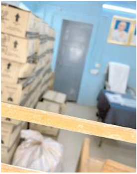
పట్టుబడిన తెలంగాణ మధ్యం

కొత్తపల్లి, మేజర్ న్యూస్: ఎన్నికల వేళ తెలంగాణ రాష్ట్రం నుంచి తెలంగాణ మధ్యంను తరలిస్తుండడంతో పోలీసులు పట్టుకున్నారు. పోలీసులు తెలిపిన వివరాల మేరకు తెలంగాణ రాష్ట్రం నుంచి కృష్ణానది మీదుగా దాటి సంగమేశ్వరం వద్ద తెలంగాణ మధ్యం సీసాలను ఒక వాహనంలో తరలిస్తుండగా అందిన సమాచారం మేరకు వెళ్లి పట్టుకున్నారు. దాదాపు 91 బాక్సులలో ఈ మధ్యం సీసాలను ఒక ప్రత్యేక వాహనంలో తరలిస్తుండగా నలుగురు వ్యక్తులతో పాటు మధ్యం సీసాలను, బొలెరో వాహనాన్ని స్వాధీనం చేసుకొని పోలీసు స్టేషన్లో ఉంచినట్లు ఎస్ఐ హరి ప్రసాద్ తెలిపారు. వీరిపై కేసు నమోదు చేయడం జరిగిందన్నారు. ఈ మధ్యం విలువ దాదాపు రూ.5లక్షల 60వేలు ఉంటుందని తెలిపారు. ఎన్నికల వేళ తెలంగాణ మధ్యానికి భారీగా డిమాండ్ ఏర్పడింది. ప్రతిరోజూ ఏదో ఒక రూపంలో పోలీసుల కళ్లుగప్పి తెలంగాణ మధ్యాన్ని తరలిస్తున్నారు.