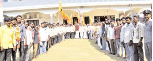
టీడీపీలో చేరిన దృశ్యం

కర్నూలు రూరల్, మేజర్ న్యూస్: కర్నూలు మండలం దిన్నెవరపాడు గ్రామానికి వైసీపీ నాయకులు, 30కుటుంబాలు టీడీపీలో చేరారు. టీడీపీ సీనియర్