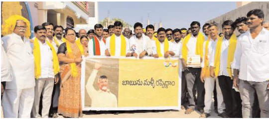
ప్రచారం చేస్తున్న టీడీపీ నాయకులు

ఈ సందర్భంగా వారు మాట్లాడుతూ వైకాపా అధినేత జగన్మోహన్ రెడ్డి నవ రత్నాలు పేరుతో నవ మోసాలు చేస్తూ పాలన సాగించారన్నారు. ఆయన పాలనతో విసుగు చెందిన రాష్ట్ర ప్రజలు వైకాపా అభ్యర్థుల ఓటమే ధ్యేయంగా రానున్న ఎన్నికల కోసం ఎదురు చూస్తున్నారన్నారు. ఇందులో బాగంగా అలూరులో టీడీపీ