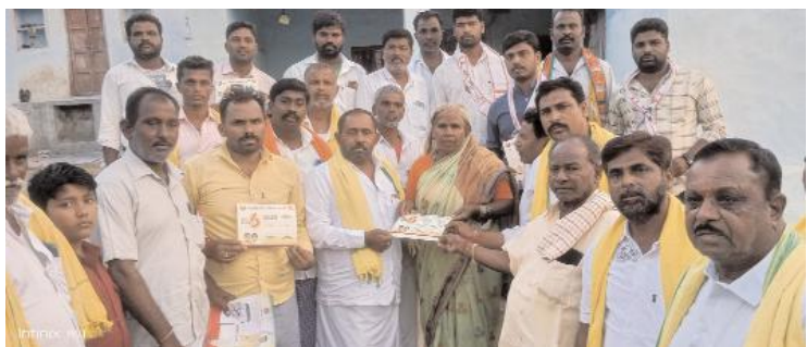
ఒకట వార్డులో ప్రచారం చేస్తున్న టీడీపీ నాయకులు