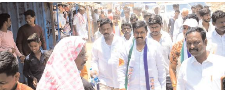
గామంలో గడప గడప ప్రచారం చేస్తున్న దృశ్యం