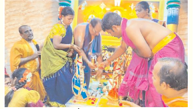
కళ్యాణోత్సవం నిర్వహిస్తున్న దృశ్యం