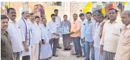
ఎన్నికల ప్రచారంలో మంత్రి బుగ్గన అభివృద్ధి గురించి వివరిస్తున్న వైకాపా నాయకులు