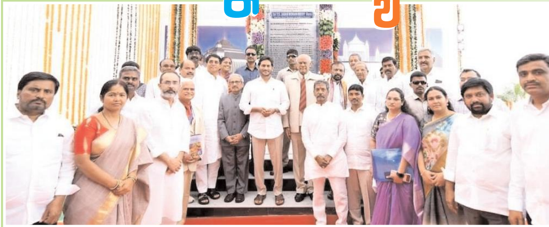
జాతీయ న్యాయ విశ్వవిద్యాలయం శంకుస్థాపన కార్యక్రమంలో పాల్గొన్న సిఎం జగన్ (ఫైల్ ఫోటో)