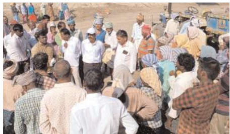
ఉపాధి హామీ కూలీలతో మాట్లాడుతున్న పిడి