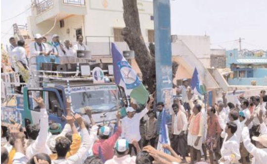
కడమలకాల్యలో ఎన్నికల ప్రచారంలో పాల్గొన్న వైసీపీ నాయకులు