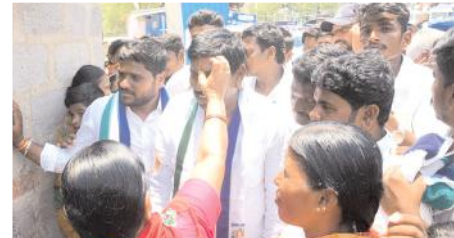
విరుపాక్షి తిలకం దిద్దుతున్న మహిళ

అత్యవసరంగా 3590 అధ్యాపకుల పోస్టుల నియామకం, ఆరోగ్యశ్రీ ని 25 లక్షల వరకు పెంపు మెరుగైన డాక్టర్స్ చే చికిత్సలు, దేవాలయాల నిర్మాణం కోసం ప్రత్యేక నిధిచిరు వ్యాపారులకు 10 వేలనుండి 15వేలకు జగనన్న తోడు, విదేశీ విద్యకు అయిన ఖర్చుకు వడ్డీ ప్రభుత్వం భరిస్తుందని, 25000 లోపు జీతం తీసుకునే వారికి వర్తింపు, జిల్లా కేంద్రాల్లో మౌలిక