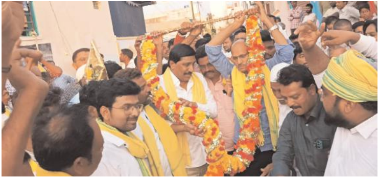
మాజీ ఎమ్మెల్యే బీసీకి స్వాగతం పలుకుతున్న దృశ్యం