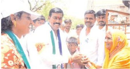
అవ్వను ఓటు అడుగుతున్న దృశ్యం

తీసుకెళ్ళాల్సిన బాధ్యత కార్యకర్తలపై ఉందన్నారు. ఈ కార్యక్రమంలో టిడిపి నాయకులు, కార్యకర్తలు పాల్గొన్నారు.