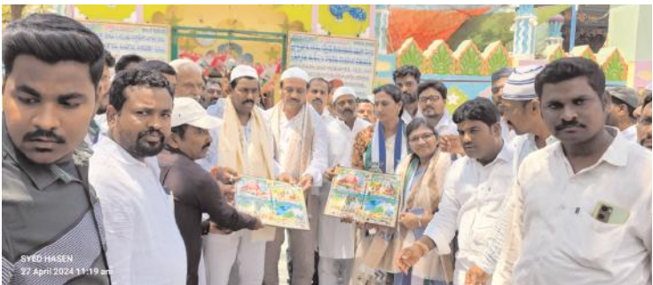
ఎల్లారెడ్డిలో షాహిద్ తాతల దర్శనం చేసిన అభ్యర్థి బుసినే విరుపాక్షి