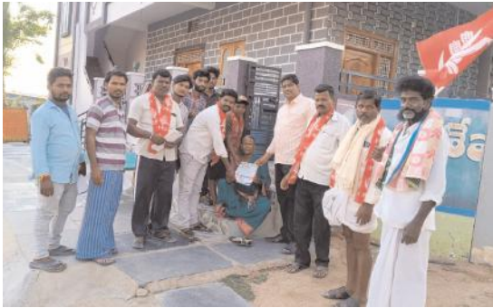
ప్రచారం నిర్వహిస్తున్న సీపీఐ నాయకులు