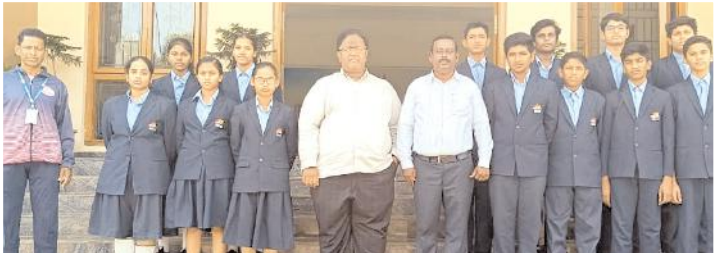
విద్యార్థిని, విద్యార్థులను అభినందిస్తున్న దృశ్యం