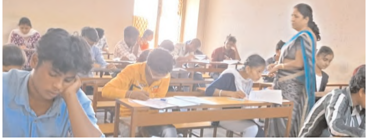
పాలిసెట్కు పరీక్షలు రాస్తున్న విద్యార్థిని, విద్యార్థులు