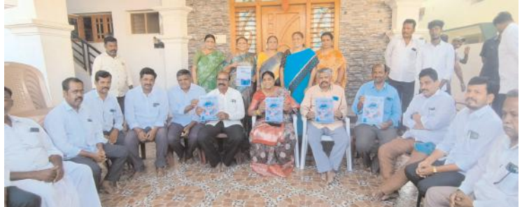
సమావేశంలో మెనూఫెస్టోను విడుదల చేస్తున్న ఎమ్మెల్యే