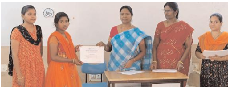
విద్యార్థినికీ ద్రువపత్రాలు అందిస్తున్న ప్రిన్సిపాల్ లక్ష్మీప్రసాన