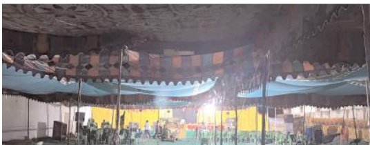
బహిరంగ సభ ప్రాంగణం

నేడు శ్యామ్ ఆత్మీయ సమావేశం - హజారు కానున్న రాజకీయ నేతలు