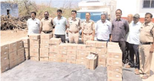
పట్టుబడ్డ అక్రమ మద్యంతో సెబ్ పోలీసులు