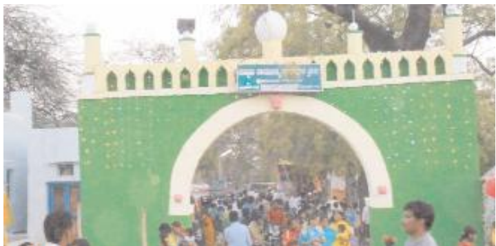
సాయిబన్నదాద దర్గా ముఖద్వారం