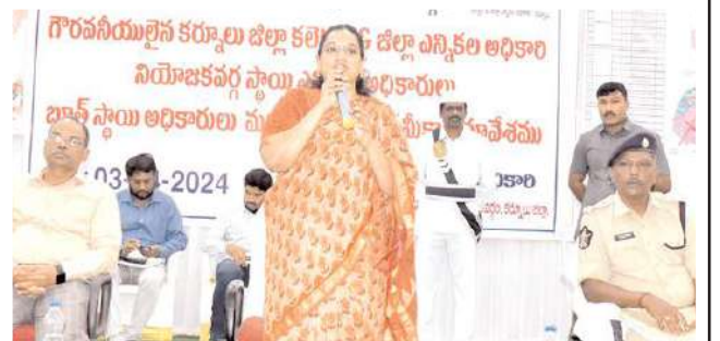
మాట్లాడుతున్న కలెక్టర్ సృజన

సర్వత్రాక ఎన్నికల సందర్భంగా ఎన్నికల సంఘం ఎప్పటికప్పుడు జారీ చేసే ఆదేశాలు, నియమాలు నిబంధనలు ప్రతి ఒక్కరూ తప్పనిసరిగా పాతకాలను జిల్లా ఎన్నికల అధికారి, జిల్లా కలెక్టర్ డా.జి.సృజన సంబంధిత అధికారులను ఆదేశించారు. బుధవారం ఎమ్మిగనూరు పట్టణంలోని బాబు ఫంక్షన్ హాలులో ఎమ్మిగనూరు నియోజకవర్గానికి సంబంధించి సాధారణ ఎన్నికలు-2024 నిర్వహణ పై బాత్ లెవెల్ స్టాయి అధికారులకు, సెక్టోరల్ మీగతా 2లో