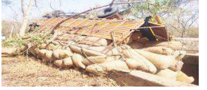
లారీ ప్రమాదవశాత్తు బోల్తా పడినట్లు హైచే పోలీసులు తెలిపారు. ఈ ప్రమాదంలో లారీ డ్రైవర్, క్లీనర్ స్వల్ప గాయాలతో బయట పడ్డారని, పెను ప్రమాదం తప్పినట్లు వారు తెలిపారు.