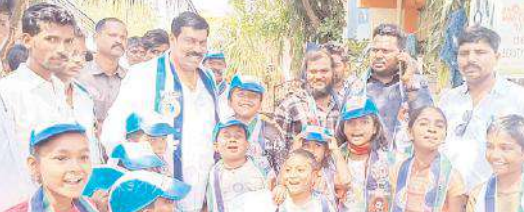
జగన్ మామయ్యకే మా తల్లిదండ్రుల ఓట్లు అంటున్న చిన్నారులు

జగన్ మామయ్యకు జిందాబాద్ అంటున్న చిన్నారులు