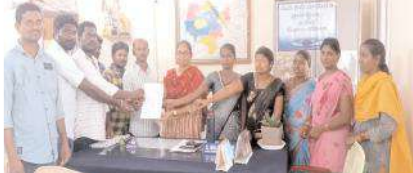
రాజీనామా పత్రాలు అందజేస్తున్న దృశ్యం