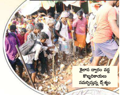
కైలాస ద్వారం వద్ద కొబ్బరికాయలు సమర్పిస్తున్న డ్విజ్ కు