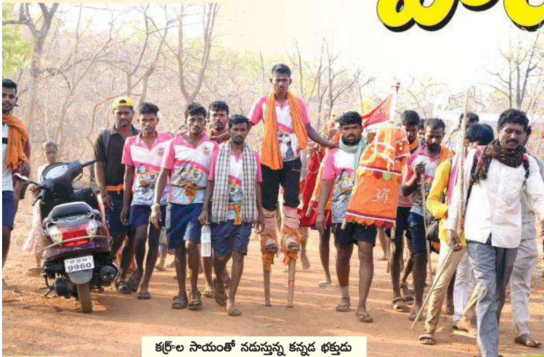
కర్నూలు సాయంతో నడుస్తున్న కన్నడ భక్తుడు