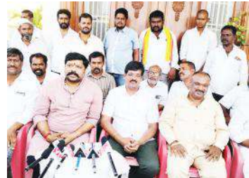
సమావేశంలో మాట్లాడుతున్న టిడిపి నాయకులు కలిసి శ్రమించాలి గాని, కార్యకర్తల మనోభావాలు దెబ్బతీసి విధంగా వ్యాఖ్యలు చేయడం, టిడిపి మనసుగడకే ముప్పు వాటిల్లితమం దన్నారు. గత కొన్ని రోజులుగా టిడిపీలోని