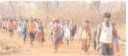
నల్లమల ఆడవుల గుండా పాదయాత్రగా వస్తున్న కన్నడిగులు

కర్ణాటక రాష్ట్రంలోని బైన్వాల, కన్నుల్లి, కూడలి, కపాలి, సోలా పూర్, బాగల్ కోటా, అత్తిని, బజారి, గుల్బర్గా, ఉగ్గి, సింధన కునూర్, అరికెరి, రాయచూర్ వంటి సుదూర ప్రాంతాల నుంచి వందలాది కిలోమీటర్లు కాలినడకన వస్తున్నారు. ఇందు కోసం 15 రోజులు నుంచి లేదా నెల ముందు తమ సొంత ప్రాంతాల నుంచి బయలుదేరారు.