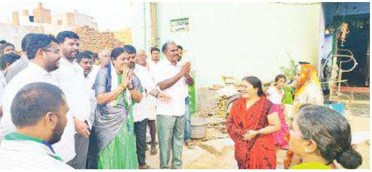
స్యాన్ గుర్తుకు ఓటు వేయాలని మహిళలను కోరుతున్న ఎమ్మెల్యే, నాయకులు