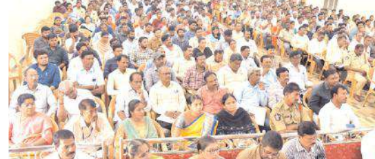
సమావేశంలో హాజరైన వివిధ శాఖల అధికారులు

అధికారులకు, ఎంపిసి బృందాలకు నియోజకవర్గ స్థాయి సమావేశం నిర్వహించారు. ఈ సందర్భంగా జిల్లా కలెక్టర్ మాట్లాడుతూ ఎన్నికల విధులలో సిబ్బంది సొంత నిర్ణయాలు తీసుకోకుండా ఎన్నికల కమిషన్ ఇచ్చిన మార్గనిర్దేశకాలను పాటిస్తూ వారికి ఇచ్చిన బాధ్యతలను నిర్వహించాలన్నారు. పోలింగ్ రోజున బిఎల్ ఓలు, సెక్టార్ ఆఫీసర్లు ఈవిఎలను ఏ విధంగా కనెక్ట్ చేయాలి, ఏ విధంగా తొలగించాలి, మాక్ పోల్ నిర్వహణ, మాక్ పోల్ స్లిప్స్ నిర్వహణ, మాక్ పోల్ క్లియర్ చేయడం, పోలింగ్ యంత్రాలపై పూర్తి స్థాయి అవగాహన పెంచుకోవాలన్నారు. పోలింగ్ పూర్తి అయిన వెంటనే కంట్రోల్ యూనిట్, బ్యాలెట్ యూనిట్, వివిప్యాట్ మిషన్లు, వివి ప్యాట్ స్లిప్స్, పిఓ డైరీ 17(సి), పిఓ రిపోర్ట్ తో స్ట్రాంగ్ రూమ్ లో చేర్చేలా పోలింగ్ సిబ్బంది చర్యలు తీసుకోవాలన్నారు. అందరికంటే ముందుగా ఎన్నికలకు సంబంధించిన విధులను బిఎల్ ఓలు ప్రారంభించడం జరిగిందన్నారు. బిఎల్ ఓలు పోలింగ్ కు మూడు రోజులు ముందు ఓటర్ స్లిప్స్ పంపిణీని పూర్తి చేయాలని, అందులో ఏవైనా స్లిప్స్ మిగిలిపోతే ఆర్ ఓకు అందజేయాలన్నారు. పోలింగ్ కేంద్రాలలో ఎటువంటి లోపాలు ఉన్నాయని సెక్టార్ లో అధికారులు, బిఎల్ ఓలు మా దృష్టికి తీసుకొని వస్తే అందుకు తగిన చర్యలు తీసుకుంటామన్నారు. లా అండ్ ఆర్డర్ నిర్వహణ కోసం సెక్టార్ ఆఫీసర్లకు మెజిస్ట్రేయల్ పవర్స్ ఇవ్వడం జరిగిందని, అందుకు గాను తహశీల్దార్లు, రిటర్నింగ్ అధికారులు సెక్టార్ ఆఫీసర్లకు వాటి వినియోగంపై వారికి శిక్షణ ఇవ్వాలన్నారు. ఓటు హక్కును ఎటువంటి