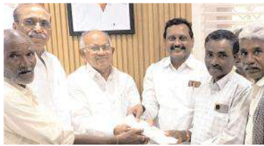
పుసులూరు గ్రామస్థులకు ఆలయ నిర్మాణానికి విరాళం అందజేస్తున్న దృశ్యం