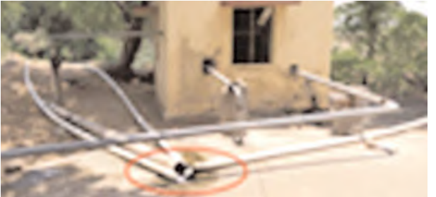
ఫిల్టర్ చేయకుండా స్టోరేజి ట్యాంకులోకి వదులుతున్న తుంగభద్ర నది నీరు

ఎన్ఎపి ఫిల్టర్ బెడ్స్ నుంచి మంత్రాలయంతో పాటు మరో 11 గ్రామాలకు నీటి సరఫరా జరిగింది. అయితే ఇక్కడ ఉన్న ఒకేఒక్క మోటారు విద్యుత్ షార్టుసర్క్యూట్ తో కాలిపోవడంతో ఎన్ఎపి ఫిల్టరు బెడ్స్ నీటి సరఫరా నిలిచిపోయింది. కేవలం ఒక్క స్టాండ్ బై మోటారు లేకుండా పథకాన్ని నిర్వహిస్తూ అధికారులు ప్రజలకు తాగు, వాడుక నీటిని అందించడం జరుగుతోంది. ఒక్కో ప్రాంతానికి చెందిన మోటారు ఇంజను కాలిపోయినపుడు దీనికి ప్రత్యామ్నాయంగా మరో మోటారు ఇంజనును స్టాండ్ బై కింది ఆర్డబ్ల్యూఎస్ అధికారులు ఎందుకు ఏర్పాటు చేయడంలేదో వారికే ఇది తెలియాలి. మోటారు ఇంజను రిపేరి అవడానికి ఎన్ని రోజులు పడుతుందో అన్ని రోజులు ప్రజలకు నీటి సరఫరా ఉండదని చెప్పవచ్చు. మంత్రాలయంలో నీటిఎద్దడి నివారణకు ఏర్పాటు చేసిన ఓవర్ హెడ్ ట్యాంకులు అలంకారప్రాయంగా మారాయి. తీవ్రతరమైన ఈమంచు వేసవిలో గ్రామాల్లో తరచూ పర్యటించి నీటి ఎద్దడి స్థితిగతులు విచారించే తీరిక సంబంధిత అధికారులకు ఉన్నట్టులేదన్నది ప్రజల అభిప్రాయం. మంత్రాలయం సమీపంలో ప్రవహిస్తున్న తుంగభద్రనది నీటి జాడలేక ఎవరిని తలపిస్తోంది. మంచు ఈ వేసవిలో భూగర్భ జలాలు ఇంకిపోయి బోర్లకు సైతం అందటం లేదు. దీనిపై జిల్లా ఉన్నతాధికారులు వెంటనే స్పందించి ప్రత్యామ్నాయం ఏర్పాటు చేయగలిగితే స్థానిక ప్రజలకు మేలు చేసినట్లు అవుతుందని చెప్పవచ్చు.