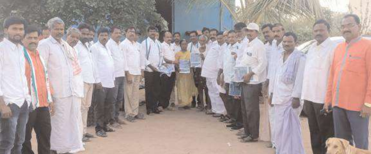
ఎన్నికల ప్రచారంలో పాల్గొన్న వైకాపా నాయకులు