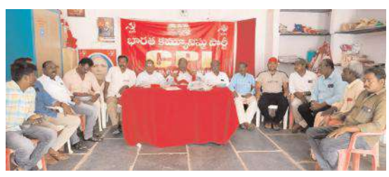
మాట్లాడుతున్న సిపిఐ నాయకులు