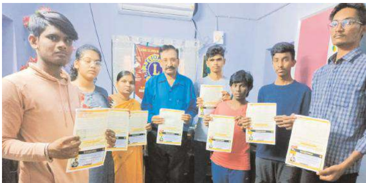
కరపత్రాలు విడుదల చేస్తున్న దృశ్యం