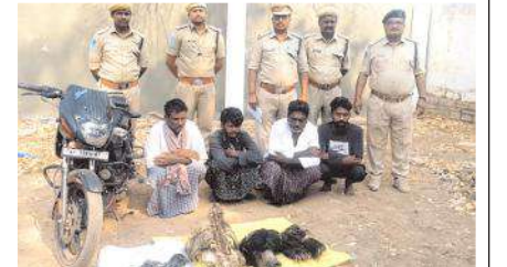
వేటగాళ్లను అదుపులోకి తీసుకున్న అటవీ శాఖ అధికారులు