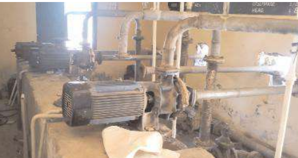
మోటార్లు ఏర్పాటు చేసిన గది

సూగూరు సమూర్ స్టోరేజి ట్యాంకు:- మంత్రాలయం, పరిసర గ్రామాల్లో వేసవిలో నీటిఎద్దడి తలెత్తకుండా ఉండేందుకు సూగూరు సమీపంలో రు 8,49,18,680 లతో సమూర్ స్టోరేజి ట్యాంకును ఏర్పాటు చేసి తుంగభద్ర నదినుంచి ఎత్తిపోతల ద్వారా అట్యాంకును నింపడం జరిగింది. వేసవి తీవ్రత తో గతంలో ఎన్నడూ లేని విధంగా ఎండలు మండిపోతున్నాయి. వేసవి తీవ్రత రోజురోజుకూ తీవ్రతరం అవుతోంది. ఈతీవ్రతకు అనుగుణంగా మంచినీటిని ప్రజల అవసరాలకు అనుగుణంగా సరఫరా చేయడం జరిగింది. తర్వాత ఈస్కిం నిర్వహణ ప్రైవేటు వ్యక్తుల చేతుల్లోకి చేరింది. ఈకారణంగా నిర్వహణలోపం కొట్టొచ్చినట్లు కనిపిస్తోంది.