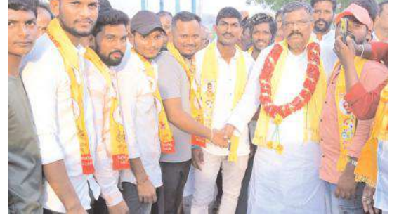
కోట్లకు స్వాగతం పలుకుతున్న గ్రామ యువకులు