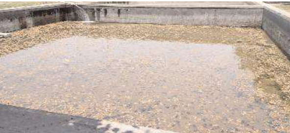
కొద్దిపాటి నీటితో ఉన్న ఫిల్టరు బెడ్ ఛాంబరు

2009లో అక్టోబరులో తుంగభద్ర నది ఉగ్రరూపంతో తీరప్రాంతాలను అల్లకల్లోలం చేసింది. ఆ ఆపత్సమయంలో కర్నూటక రాష్ట్రం అప్పటి ముఖ్యమంత్రి యడ్లూరిపల్లి వరద తీవ్రతపై స్పందించి మంత్రాలయం శ్రీమతానికి రు 10 కోట్లను కేటాయించడం జరిగింది. ఇందులో భాగంగా రు 5 కోట్లతో మంత్రాలయం గ్రామప్రజలకు మంచినీటి సౌకర్యం కల్పించేందుకు కొండాపూర్ అంజనేయస్వామి ఆలయం సమీపంలో శ్రీమతం భూమిలో శ్రీవ్యాసతీర్థ రక్షిత మంచినీటి పథకం ఏర్పాటు చేయడం జరిగింది. శ్రీమతం అప్పటి పీఠాధిపతులు పరమపూజ్య శ్రీసుయతీంద్రతీర్థల ఆప్తకార్యదర్శి సుయమీంద్రాచార్యులు మంత్రాలయం సమీపంలోని కలుదేవకుంట గ్రామానికి సైతం శ్రీవ్యాసతీర్థ రక్షిత మంచినీటి పథకం నీటిని ఇవ్వడానికి నిర్ణయించారు. ఈ మేరకు మంత్రాలయం శ్రీవ్యాసతీర్థ రక్షిత పథకం నుంచి కలుదేవకుంట వరకు పైపులైన్ ఏర్పాటు చేసి ఆ గ్రామంలో ఓవర్ హెడ్ ట్యాంకును ఏర్పాటు చేసింది. అయితే