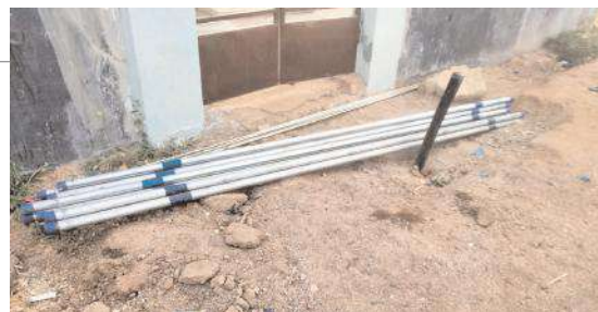
మరమ్మత్తులకు నోచుకోని చేతి పంపు బోరు, పైపులు

కోరుతున్నారు. ఉద్యోగిపై ఉన్నతాధికారులు చర్యలు తీసుకోవాలని కాలనీవాసులు డిమాండ్ చేస్తున్నారు.