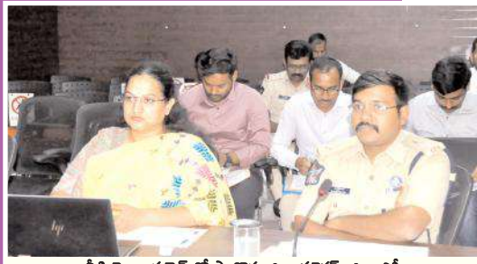
పీడియా కాన్ఫరెన్స్లో పాల్గొన్న జిల్లా కలెక్టర్, జిల్లా ఎస్పీ

శాంతిగా, స్వేచ్ఛగా, న్యాయంగా ఎన్నికలు నిర్వహించే బాధ్యత డిఇబలు, ఎస్పీలదే