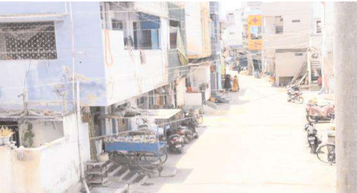
నిర్వాసుషంగా మారిన నగర వీధులు

- భానుడి భగభగలతో నగర వీధులు ఖాళీ - దేశంలో అత్యధికంగా ఉష్ణోగ్రతలు నమోదు - గత ఐదురోజులుగా విలవిలలాడుతున్న ప్రజలు