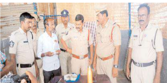
గాజులపల్లి చెక్ పోస్ట్ వద్ద స్వాధీనం చేసుకున్న నగదును చూపుతున్న పోలీసులు

మహానంది, మేజర్ న్యూస్ : మహానంది మండలంలోని గాజులపల్లి