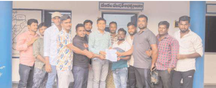
రాజీనామ పత్రాలను ఎంపిడిఓకు అందిస్తున్న వాలంటీర్లు

ప్రత్యేక బడ్జెట్ కేటాయింపకుండా ఐదేళ్లు ముస్లింలను ప్రభుత్వం మోసం చేసిందన్నారు. జగన్ ను మైనార్టీలు నమ్మే పరిస్థితి లేదన్నారు. వైద్య రంగాన్ని పూర్తిగా విస్మరించారన్నారు. డాక్టర్ల కోరత, మందుల కోరత తీవ్రంగా ఉందన్నారు. 151 మంది ఎమ్మెల్యేలు గెలుపొందితే 50 శాతం ఎమ్మెల్యేల పేర్లు ముఖ్యమంత్రికి గుర్తు పెట్టుకునే పరిస్థితి లేదని ఎద్దేవా చేశారు.