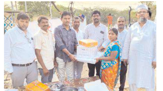
బాధితులకు వంట సామాగ్రి అందజేస్తున్న రెడ్ క్రాస్ సభ్యులు