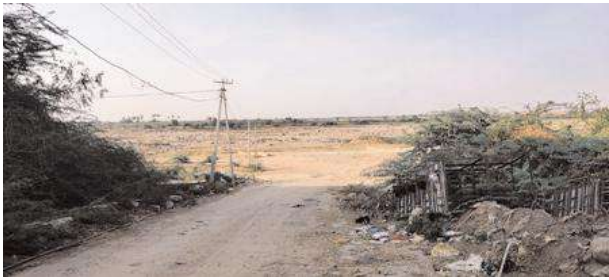
వేసవి తీవ్రతతో నీటిజాడ కానరాని తుంగభద్రనది