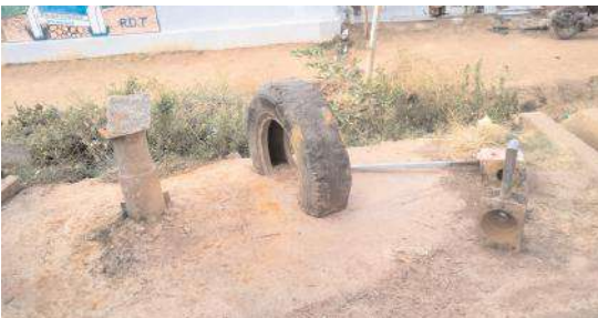
మరమ్మత్తులకు నోచుకోని చేతి పంపు బోరు, పైపులు

మంత్రాలయం మండల పరిధిలోని బుధూరు ఎస్సీ కాలనీలో సుమారు 200కుటుంబాలు జీవనం కొనసాగిస్తున్నారు. తాగునీటి కోసం చేతిపంపుపై ఆధారపడ్డారు. చేతిపంపు పైపులు లీక్ కావడంతో నీరు రాకపోవడంతో తాగునీటి కష్టాలు తప్పడం లేదు. కాలనీ వాసులు పొల్లల వద్ద 2కి.మీ., వెళ్ళి ఇబ్బందులకు గురవుతున్నారు. బోరుకు మరమ్మత్తులు చేయించి సమస్యను పరిష్కరించాలని ఎంపిడిఓకు వినతిపత్రం అందించడం జరిగింది. ఎంపిడిఓ ఆర్డర్ బ్యూఎస్ అధికారులు స్పందించి నూతన పైపులు, బోరుకు కావాల్సిన సామాగ్రి అందజేశారు. మెకానిక్ బోర్లో నూతన పైపులు వేసి మరమ్మత్తులు చేయాలని అధికారులు ఆదేశించినా కాలనీ వాసులు కోరినా, పట్టించుకోవడం లేదని మండి పడుతున్నారు. రేపు, మాపో అంటూ, కాలయాపన చేస్తున్నారని ఆరోపించారు. బోరు లేకపోవడంతో తాగునీటి కోసం నీటి కష్టాలు తప్పడం లేదని ఆవేదన వ్యక్తం చేశారు. ఆ బోరును బాగు చేయించి తాగునీటి సమస్యను పరిష్కరించాలని ఉన్నతాధికారులు