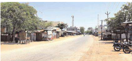
మధ్యాహ్నం 12 గంటల సమయంలో గోనెగండ్లలో నిర్మాణంపూర్తి మాలిన ప్రధాన వీధులు గోనెగండ్ల, మేజర్ స్క్వాస్: ఈ వేసవిలో ఇప్పటికే ఎండలు మండిపోతున్నాయి.

న్యాయి. మధ్యాహ్నం 11.30 దాటితే జనం ఆరుబయటకు రావడం మానేశారు. ఎండ తీవ్రత 42 డిగ్రీలు దాటి పోత ఉంది. దీంతో ప్రధాన వీధులు నిర్మాణంపూర్తి మాలిన పాట పశుపక్షులు కూడా తిరగడం లేదు. కూల్చివేయి, చెరుకురం వ్యాపారులు జనం కోసం వేచి చూడాలివస్తుంది. పదవ తరగతి, ఇంటర్ మీడియట్ పరీక్షలు కూడా ముగియడంతో విద్యార్థులు సైతం రోడ్డుపై కనిపించడం లేదని కూల్ డ్రింక్ వ్యాపారులు తెలుపుతున్నారు. ఏప్రిల్ నెలలోనే ఈ విధంగా ఎండలు మండిపోతుంటే ఇక మే నెలలో ఎండ తీవ్రత ఎంత ఉంటుందో అని జనం ఆందోళన చెందుతున్నారు.