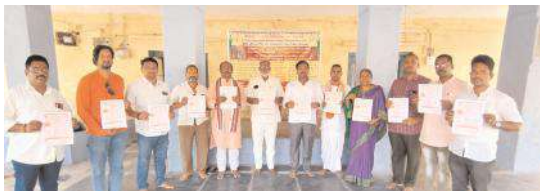
కరపత్రాల ఆవిష్కరణ దృశ్యం