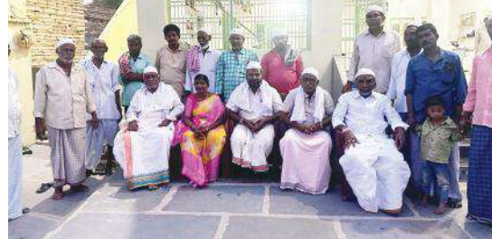
శాలువాలతో సన్మానిస్తున్న ముస్లిం సోదరులు