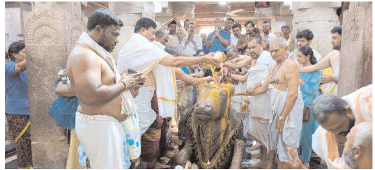
మహానంది క్షేత్రంలో నందిశ్యరునికి అభిషేకం నిర్వహిస్తున్న దృశ్యం