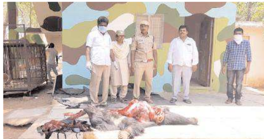
ఎలుగుబంటికి పోస్టుమార్టం నిర్వహిస్తున్న దృశ్యం