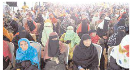
హాజరైన మైనారిటీ మహిళలు

అంశం పై బెన్లల ఆత్మీయ సమ్మేళనం నిర్వహిస్తున్నట్లు తెలిపారు. ఈ సమ్మేళనానికి రాజకీయ పార్టీలకు అతితంగా బెన్లలు అందరూ తరలిరావాలని కోరారు.