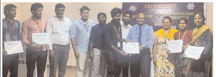
విద్యార్థులకు నర్సింగ్ కృషి అందజేస్తున్న దృశ్యం