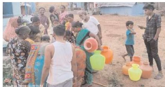
పొల్లల వద్ద నీటిని తెచ్చుకుంటున్న కాలనీవాసులు

కోరుతున్నారు. ఉద్యోగిపై ఉన్నతాధికారులు చర్యలు తీసుకోవాలని కాలనీవాసులు డిమాండ్ చేస్తున్నారు.