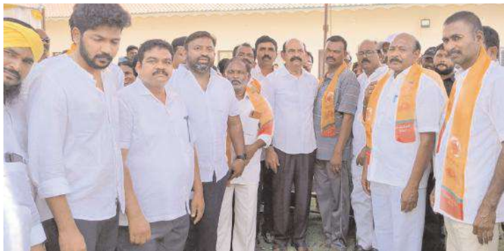
అహోబిల స్వామికి వెండి కవచం అందజేస్తున్న దృశ్యం