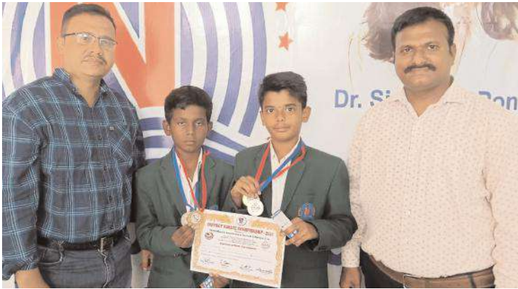
విద్యార్థులను అభినందిస్తున్న దృశ్యం