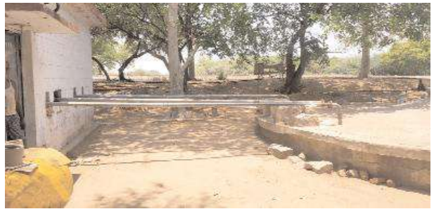
తుంగభద్ర నది తీరంలో ఏర్పాటు చేసిన ఫిల్టరు బెడ్స్