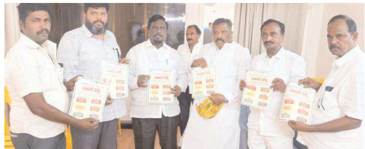
పోస్టర్ను అవిష్కరిస్తున్న కోట్ల