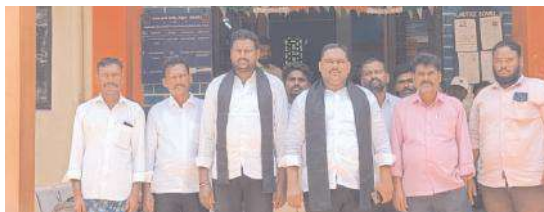
సమావేశంలో మాట్లాడుతున్న ఎమ్మార్పిఎస్ నాయకులు