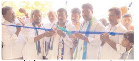
చిప్పగిరి లో పార్టీ కార్యాలయాన్ని ప్రారంభిస్తున్న ఇంచార్జ్ విరుపాక్షి