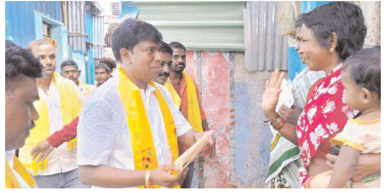
19వ వార్డులో ఎన్నికల ప్రచారం చేస్తున్న టీడీపీ అభ్యర్థి బీవీ

19వ వార్డు ఎన్నికల ప్రచారంలో టీడీపీ అభ్యర్థి బీవీ