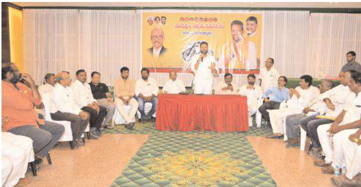
మాట్లాడుతున్న టీజీ భరత్