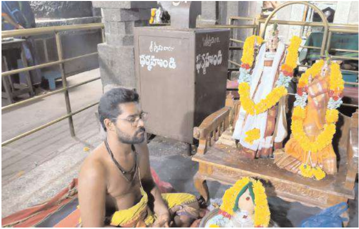
ఉమామహేశ్వరుల కళ్యాణ దృశ్యం