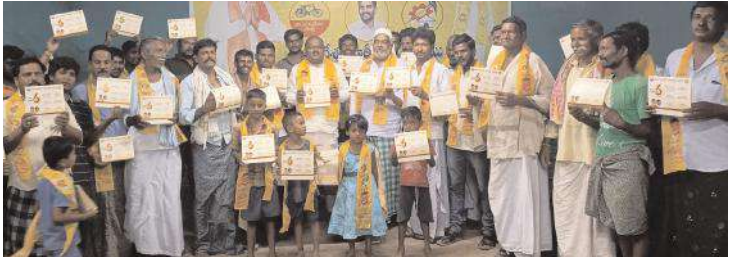
ఎల్లారితో కరపత్రాలతో నినాదాలు చేస్తున్న దృశ్యం