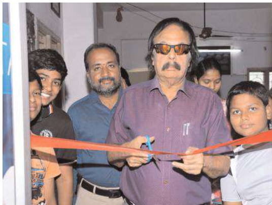
శిక్షణ తరగతులను ప్రారంభిస్తున్న దృశ్యం