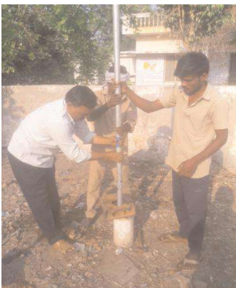
బోరుకు మరమ్మత్తులు చేసిన అధికారులు

- సూర్య ఏఫెక్ట్ పత్రికొండ టౌన్, మేజర్ న్యూస్ :