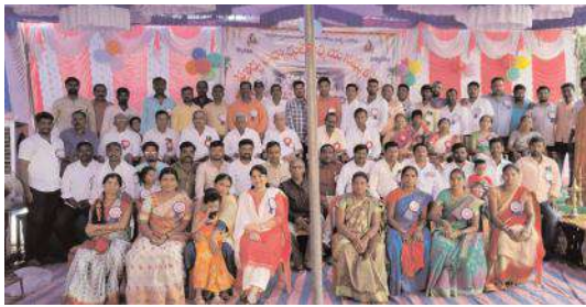
గురువులను సన్మానిస్తున్న పూర్వపు విద్యార్థులు