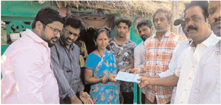
ఆర్థిక సాయం అందజేస్తున్న ప్లంబర్ అసోసియేషన్ సభ్యులు