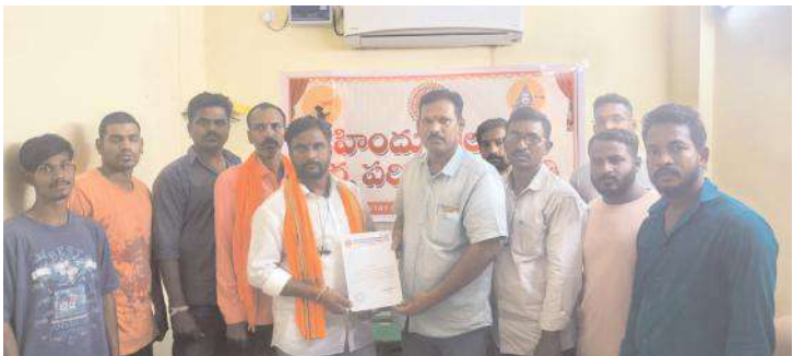
నియామక పత్రాలు అందజేస్తున్న దృశ్యం