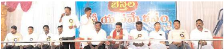
సమావేశంలో మాట్లాడుతున్న బెన్ల సంగం నాయకులు