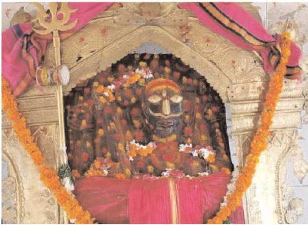
దర్శించుకునేందుకు మరో పది రోజుల పాటు భక్తుల రద్దీ ఉంటుంది.

20 రోజుల పాటు జాతర ఈ మహా జాతర పది రోజుల పాటు కొనసాగుతుంది. 24 నుంచి ఉత్సవాలను ప్రారంభిస్తారు. తొలిరోజు పోలేరమ్మదేవతకు భోనాలు, 25న పోచమ్మ దేవతకు భోనాలు, 26న దుర్గమ్మ తల్లి భోనాలు, 27 బేతాకు స్వామికి భోనాలను సమర్పిస్తారు. 28న ఆలయం చుట్టు వివిధ గ్రామాల నుంచి వచ్చిన ఎద్ద బండ్లను ఊరేగింపు ఉంటుంది. 29న అధ్యాత్మిక కార్యక్రమాలు, భజనలు, 30న భాగవత కార్యక్రమాలు, మే1వ తేదీన భక్తుల కోసం వినోద కార్యక్రమాలు, 2వ తేదీన బేతాకుడికి పాచిబండ్ల ఊరేగింపు ఉంటుంది. ఈ ప్రత్యేక కార్యక్రమాలు పూర్తయినా స్వామిని