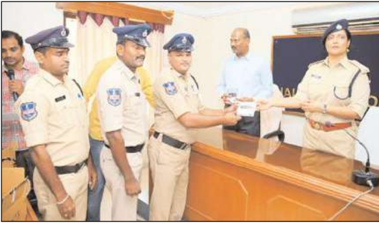
నల్గొండ జిల్లా బ్యూరో

సైబర్ నేరాలకు బాధితులు 1930కు గాని సైబర్ క్రిమ్ పోర్టల్లో తక్షణమే నమోదు చేయాలన్నారు. సైబర్ నేరాలకు గురైన బాధితుల నుండి ఫిర్యాదు అందిన వెంటనే పోలీస్ స్టేషన్ల వారిగా నియమించిన సైబర్ వారియర్స్ తక్షణమే స్పందించి తగు చర్యలు తీసుకోవాలని జిల్లా ఎస్పీ పోలీస్ సైబర్ వారియర్స్ అధికారులను ఆదేశించారు. బుధవారం జిల్లా పోలీస్ కార్యాలయంలోని సమావేశ హాల్ నందు జిల్లా ఎస్పీ పోలీస్ స్టేషన్లో వారిగా నియమించిన సైబర్ వారియర్స్ కి మొబైల్ ఫోన్స్, సిమ్ కార్డ్స్ అందజేయడం అనంతరం జిల్లాలో జరుగుతున్న సైబర్ నేరాలు, ప్రజలు మోసపోతున్న తీరు, నమోదు అయిన కేసులలో ఫ్రీజ్ అయిన అసౌండ్, పోగొట్టుకున్న అసౌండ్ బాధితులకు తిరిగి అందజేసేందుకు తీసుకునే చర్యలపై అడిగి తెలుసుకున్నారు. ఈ సందర్భంగా నేరగాళ్ల పట్ల అప్రమత్తంగా ఉండాలని, అపరిచిత వ్యక్తుల నుండి వచ్చే లింకులు, మెసేజ్లు క్లిక్ చేయకూడదని, నకిలీ వెబ్సైట్ల ద్వారా అమాయకులను నమ్మించి వారి వద్ద నుండి డబ్బులు లాగేస్తున్నారన్నారు. ఇలాంటి మోసాలకు గురైతే సైబర్ క్రిమ్ పోలీసులను సంప్రదించాలని లేని యెడల్ హెల్ప్ లైన్ నంబర్ 1930 కు కాసి ఎస్సెఆర్టి పోర్టల్లో ఫిర్యాదు చేయవచ్చన్నారు.