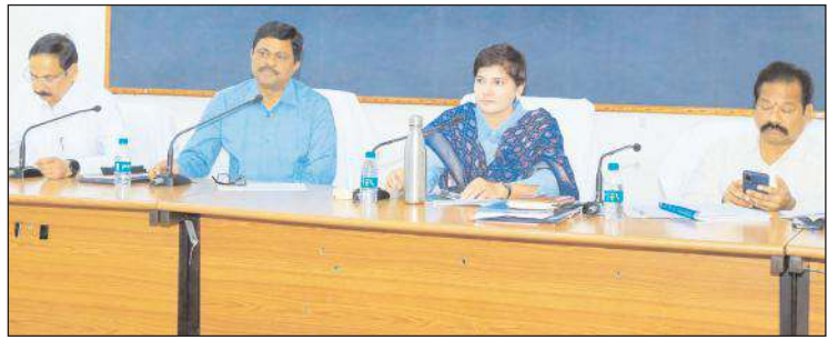
నల్గొండ జిల్లా బ్యూరో