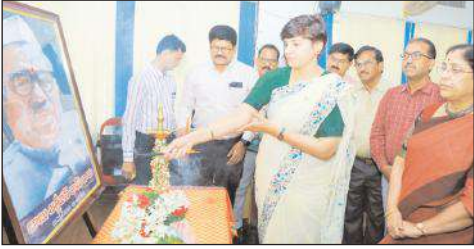
నల్గొండ జిల్లా బ్యూరో