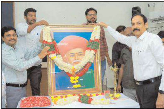
సంక్షేమ శాఖ అధికారులు, సిబ్బంది హాజరై మహాత్మా జ్యోతిబాపూలే చిత్రపటానికి పూలమాలలు వేసి నివాళులు అర్పించారు.