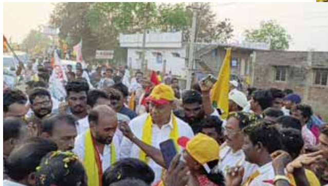
టీడీపీ అభ్యర్థులు వేమిరెడ్డి కాకర్ల కోసం భారీగా