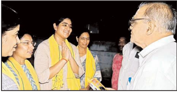
దామచర్ల, మాగుంటలను గెలిపించాలి - కుటుంబ సభ్యులు ఎన్నికల ప్రచారం