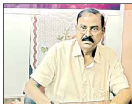
విధానానికి శ్రీకారం చుట్టి తల్లిదండ్రుల అభిప్రాయాలకు అనుగుణంగా ప్రతి విద్యార్థిపై వ్యక్తిగత శ్రద్ధ చూపుతున్న మీ, మా విద్యాసంస్థ ఎస్.ఎస్.ఎస్. ప్రస్తుతం ఈ విద్యాసంవత్సరం నుండి