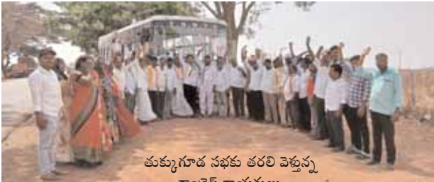
తుక్కుగూడ సభకు తరలి వెళ్తున్న కాంగ్రెస్ నాయకులు.