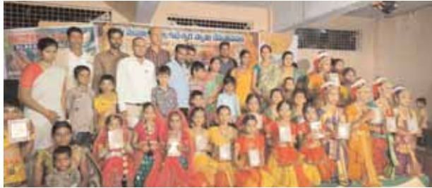
బహుమతులు అందుకున్న విద్యార్థులతో పాఠశాల ప్రిన్సిపాల్, ఉపాధ్యాయులు