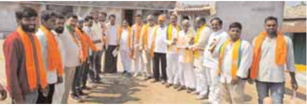
మద్దల్ చిట్టంపల్లిలో ప్రచారం చేస్తున్న బీజేపీ నాయకులు.