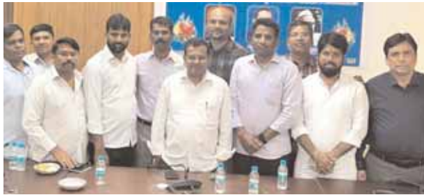
మహనీయుల జయంతి వేడుకల్లో అసోసియేషన్ నాయకులు