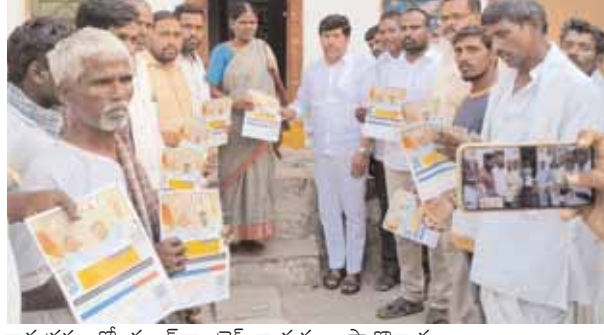
కార్యక్రమంలో యూత్ కాంగ్రెస్ నాయకులు పాల్గొన్నారు.