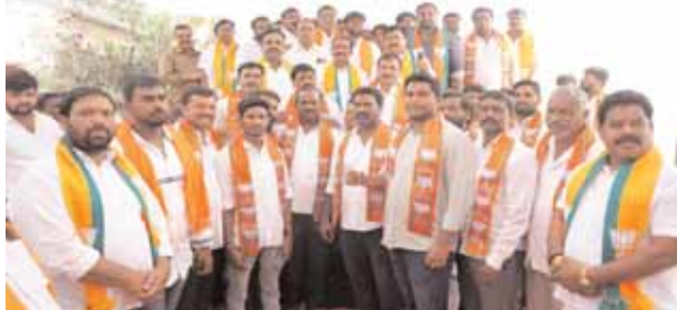
పార్టీలో చేరిన నాయకులు