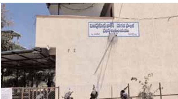
ప్రయత్నిస్తున్నారని తెలిపారు. బీజేఎంసీ కార్యాలయంలో మహిళా ఉద్యోగిస్తులకు భద్రత కరువైందని ఆవేదన వ్యక్తం చేశారు.