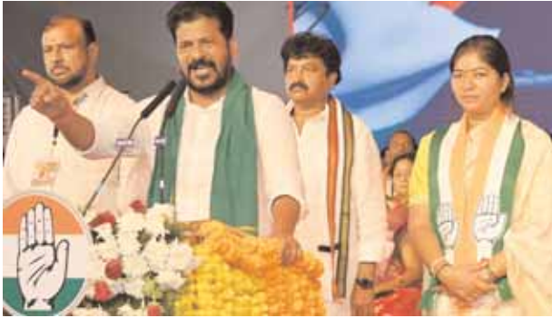
చేసుకుంటామని కాషాయ నేతలు గంభీరం ప్రదర్శిస్తున్నారు. కేంద్రంలో అధికారంలో ఉన్న బీజేపీ, రాష్ట్రంలో ప్రతిపక్షంలో ఉన్న బీఆర్ఎస్ లు కూడా ఆయా స్థానాల్లో పట్టు నిలుపుకునేందుకు ఆరాటపడుతున్నాయి.