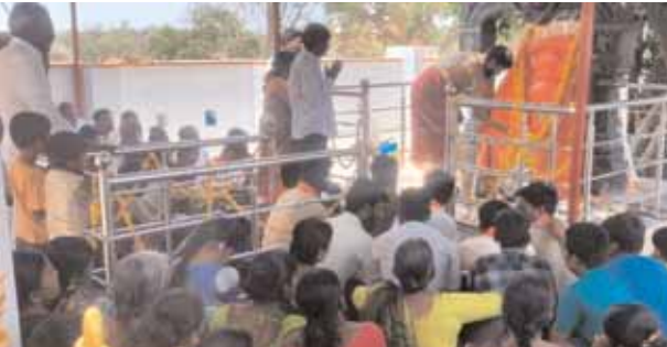
సంగాయిపల్లిలో శ్రీ అభయాంజనేయస్వామి ఆలయంలో పూజల్లో పాల్గొన్న భక్తులు

ఘనంగా శ్రీ అభయాంజనేయస్వామి జాతర ఉత్సవాలు