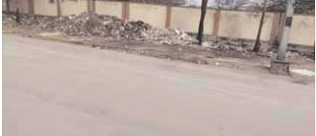
ఆ కథనానికి స్పందించి రహదారిని సోమవారం పరిశుభ్రపరచిన సిబ్బంది.

గతంలో చెత్తతో నిండిన రహదారి. బాలాపూర్ మేజర్ స్యూస్ (ఏప్రిల్ 22): ఈనెల 20వ తేదీన సూర్య దినపత్రికలో చెత్త మయంగా మారిన మీర్చేట్ మున్సిపల్ రహదారులని మన పత్రిక ప్రచురించిన వార్తకు మునిసిపల్ అధికారులు స్పందించి రహదారులను పరిశుభ్రం చేయడం పట్ల ప్రజలు హర్షం వ్యక్తం చేస్తున్నారు. సూర్య పత్రికలో ఈ వార్త రావడంతో మునిసిపల్ కమిషనర్ శానిటేషన్ సిబ్బంది మునిసిపాలిటీ పారి శుద్ధ్య సిబ్బంది అంతా సోమవారం రహదారుల పైకి వచ్చి ఎక్కడ చెత్త కనిపించిన ఆ చెత్తను సేకరించి వాహనాలలో తరలించడం పట్ల ప్రజలు ఆనందం వ్యక్తం చేస్తున్నారు. ఇదే పరిస్థితి భవిష్యత్తులో కొనసాగాలని వారు ఆకాంక్షిస్తున్నారు. ఇంకా మెయిన్ రోడ్డు మాస్టర్ మైండ్ స్కూల్ వెళ్లి రహదారిలో చెత్తను తీసివేయలేకపోయారు. ప్రజలందరూ రైతు బజార్ కూరగాయల మార్కెట్ దగ్గర మాస్టర్ మైండ్ స్కూల్ రహదారి పక్కన చెత్తను డై బై డే శుభ్రపరచడంలో సిబ్బంది సహకరించాలని పలువురు కోరుకున్నారు. ఈ సందర్భంగా వార్తలు ప్రచురించిన సూర్య దినపత్రికకి తమ కృతజ్ఞతలు తెలిపారు.