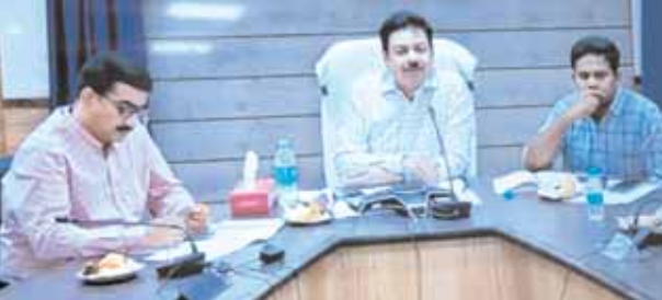
వీడియో కాన్ఫరెన్స్లో మాట్లాడుతున్న సివిల్ సప్లయ్ కమిషనర్ అధికారులు