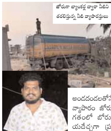
జోడూగ డ్యాంకర్ ద్వారా నీటిని తరలిస్తున్న నీటి వ్యాపారస్తులు