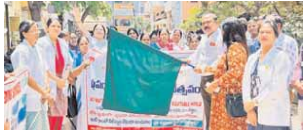
జెండా ఊపి ర్యాలీని ప్రారంభిస్తున్న దృశ్యం