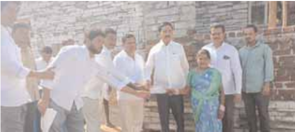
ఉడిమేశ్వరంలో ఇంటింటి ప్రచారం నిర్వహిస్తున్న కాంగ్రెస్ పార్టీ నాయకులు