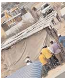
రెవెన్యూ అధికారులు గత 15 రోజుల క్రితం నీటి సరఫరా చేసే బోరు బావిని సీజ్ చేస్తున్నప్పుడు

ట్యాంకర్లను తరలిస్తున్న రెవెన్యూ అధికారులు పట్టించుకోవడంతో అక్రమ నీటి వ్యాపారస్తులకు ఇక అడ్డు అడుపు లేకుండా పోయిందని అన్నారు. ఇంత బరితెగించి నీటి వ్యాపారం చేయడానికి రెవెన్యూ అధికారులు ముడుపులు తీసుకొని సహకరిస్తున్నారని తెలిపారు. పలుమార్లు గ్రామంలో నీళ్లకు ఇబ్బంది అవుతుందని, భూగర్భ జలాలు అడుగంటిపోతున్నాయని ఫిర్యాదు చేసినా తహశీల్దార్ పట్టించుకోవడం లేదని మండిపడ్డారు. దీన్ని బట్టి చూస్తే అక్రమ నీటి వ్యాపారస్తులతో రెవెన్యూ అధికారులు కుమ్మక్కయ్యారని అర్థమవుతుందని తెలిపారు. ఇప్పటికైనా అక్రమ నీటి వ్యాపారాన్ని ప్రభుత్వ యంత్రాంగం అడ్డుకోలేకపోతే తమ గ్రామస్తులందరూ కలిసి ధర్మా నిర్వహిస్తామని హెచ్చరించారు.