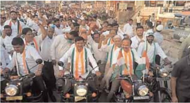
ర్యాలీ లో పాల్గొన్న ఎంపీ, ఎమ్మెల్యే

తాండూరు మేజర్ న్యూస్ (ఏప్రిల్ 26): తాండూరు పట్టణములో శుక్రవారం నాడు సాయంత్రం కాంగ్రెస్ పార్టీ ర్యాలీ ధూం ధాం గా సాగింది. పట్టణంలోని విలియంసన్ స్కూల్ చౌరస్తా నుంచి ప్రారంభమైన ర్యాలీ పట్టణంలోని ఇందిరా