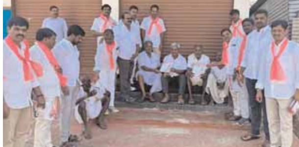
కారు గుర్తుకు ఓటు వేయాలని నాయకుల ప్రచారం