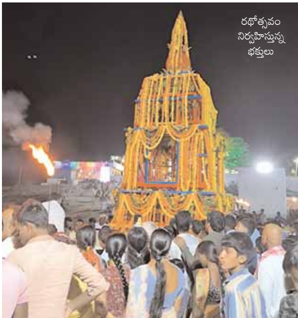
రథోత్సవం నిర్వహిస్తున్న భక్తులు