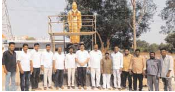
లింగాపూర్లో బాబు జగ్జీవన్ రామ్ విగ్రహానికి పూలమాలలు వేసి నివాళులు అర్పించిన నాయకులు.