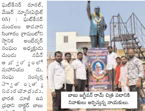
బాబు జగ్జీవన్ రామ్ చిత్ర పటానికి నివాళులు అర్పిస్తున్న నాయకులు.