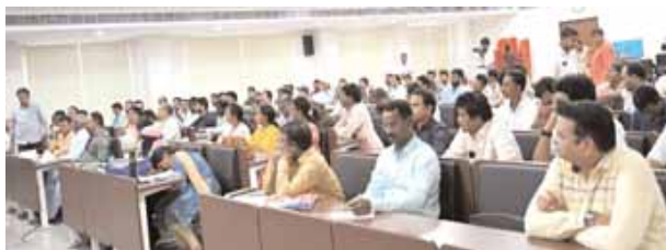
సమావేశంలో పాల్గొన్న అధికారులు.