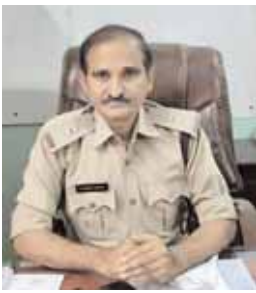
ఆయన తెలిపారు. జిల్లాలో సుమారుగా 5000 వాహనాలకు సుమారుగా రెండు కోట్ల వరకు పన్ను బకాయిలు ఉన్నాయని ఆయన అన్నారు. పన్ను బకాయిలు చెల్లించని వాటిలో ఎక్కువగా ట్రాక్టర్, ట్రైలర్లు, భారీ వాహనాలు, మధ్య, చిన్న వాహనాలు, హార్వెస్టర్ ( వ్యవసాయ సంబంధిత) , రింగ్ మౌంటెడ్ వాహనాలు ( బోర్లు వేసే వాహనాలు), గ్రామపంచాయతీ, మున్సిపల్ వాహనాలు, ప్యాసింజర్ వాహనాలు, స్కూలు బస్సులు, సీసీ (టూరిస్టు) బస్సులు ఉన్నాయని ఆయన పేర్కొన్నారు. ఇట్టి వాహనాల యజమానులు గడువులోగా పన్ను చెల్లించాలని, ఏదైనా సమాచారం కొరకు ఫోన్ నెంబర్ 9848528441 ను ద్వారా సంప్రదించవలసిందిగా ఆయన తెలిపారు.