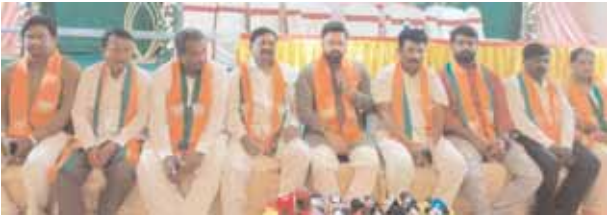
మిడియా సమావేశంలో మాట్లాడుతున్న నేతలు తాండూరు మేజర్ న్యూస్ (ఏప్రిల్ 29): తెలంగాణ రాష్ట్ర ములో బీజేపీ పార్టీ