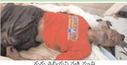
గుర్తు తెలియని వ్యక్తి మృతి

కుల్చుచర్ల మేజర్ న్యూస్ (ఏప్రిల్ 10): మృతి చెందిన వ్యక్తిని గుర్తుపడితే పోలీసులకు సమాచారం అందించాలని కుల్చుచర్ల ఎస్ఐ అన్వేష్ రెడ్డి అన్నారు. స్థానిక పోలీస్ స్టేషన్ లో