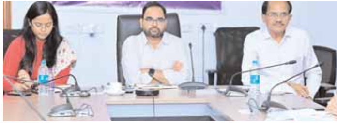
రంగారెడ్డి జిల్లా ప్రతినిధి, మేజర్ న్యూస్ (ఏప్రిల్ 10): తాగునీటి