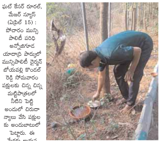
పక్షులకు నీటిని పెట్టి అందులో చిరుదా న్యాయి వేసి పక్షులకు అందుబాటులో పెట్టారు. ఈ మేరకు ఆయన మాట్లాడుతూ ప్రతి ఒక్కరు వేసవి ఎండలు మండిపోతుండడంతో పక్షులకు నీటిని అందుబాటులో ఉంచే విధంగా చూడాలని కోరారు.