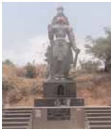
23 అడుగుల ఏకశిల