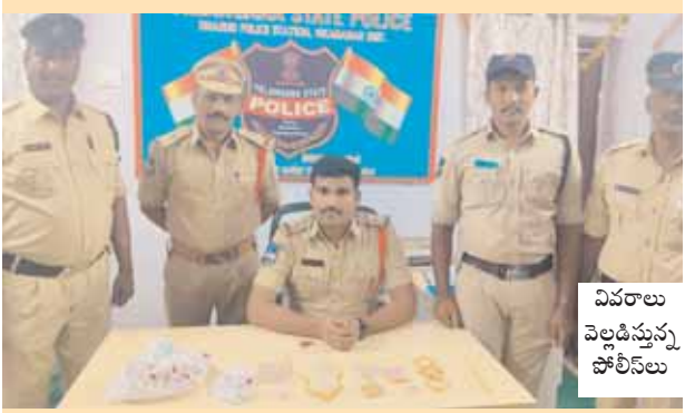
వివరాలు వెల్లడిస్తున్న పోలీసులు