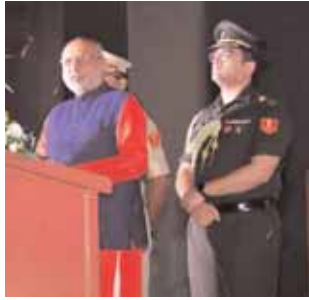
సమావేశంలో మాట్లాడుతున్న తెలంగాణ గవర్నర్ సిపి రాధా క్రిష్ణన్

ప్రణాళికను సాధికారం చేసే దిశగా విశ్వ విద్యాలయాలు కృషి చేయాలని గవర్నర్ ఆకాంక్షించారు. ఈ కార్యక్రమానికి ఏఐఐఐఐ ప్రతినిధులు, దేశంలోని వివిధ విశ్వవిద్యాలయ ఉపకుల పతులు సుమారుగా 500 మంది ఆఫ్ లైన్లో మరియు ఆన్ లైన్లో పాల్గొన్నారు. అలాగే 79 మంది విద్యావేత్తలు కలిసి రచించిన సస్ టైనబుల్ గ్రోత్ అనే గ్రంథాన్ని గవర్నర్ సీపీ రాధాకృష్ణన్ ఆవిష్కరించారు.