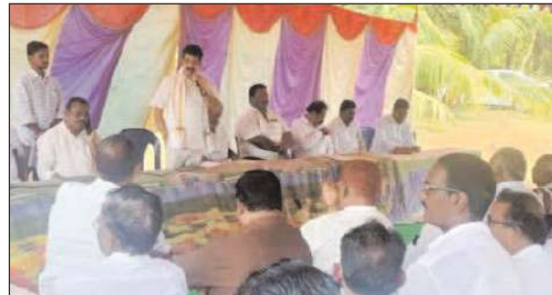
పడిన నిందను నిజం చేస్తూ జగన్మోహన్ రెడ్డి గెలుపుకు సైనికుల ఉపయోగించుకోవాలని పార్టీ కార్యకర్తలకు సూచించారు.