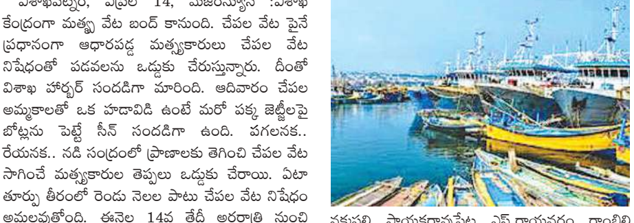
నవపల్లి, పాయకరావుపేట, ఎన్.రాయవరం, రాంబిల్లి, అచ్యుతాపురం, పరవార మండలాలు తీరంలో ఉన్నాయి. ఈ మండలాల పరిధిలో 73 కిలోమీటర్ల పొడవునా తీరం ఉండగా, 31 మత్స్యకార మిగతా 2లో

61 రోజుల పాటు వేటకు విరామం -పడవలను ఒడ్డుకు చేరుస్తున్న మత్స్యకారులు