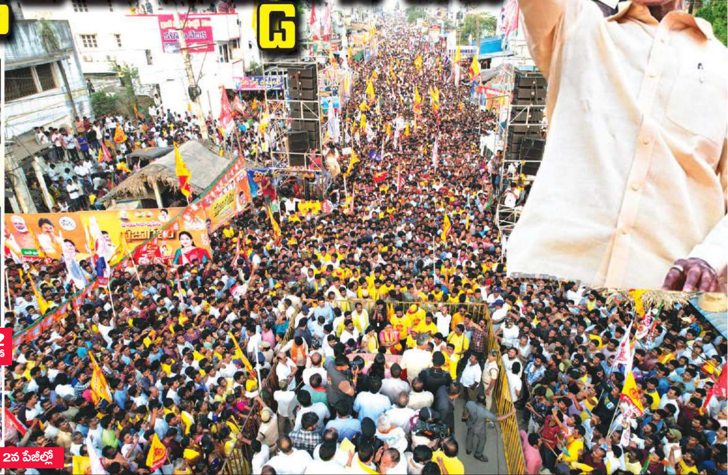
వివరాలు 2వ పేజీలో