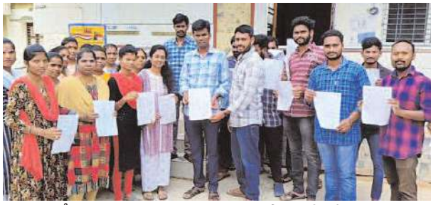
అండగా నేటి నుండి తమ వంతు కార్యకలాపాలు సాగిస్తామని, ఎన్నికల నియమావళికి అనుగుణంగా ఈ నిర్ణయాలు తీసుకున్నట్లు తమ ఇష్టపూర్వకంగా రాజీనామాలు చేసి జగనన్నకు తోడుగా నిలబడి ప్రచారంలో పాల్గొంటామని రాజీనామా చేసిన వాలంటీర్లు స్పష్టం చేశారు.

- జగనన్నకు అండగా, దానన్న గెలుపుకు ప్రచారంలో పాల్గొంటాం - స్పష్టం చేసిన వాలంటీర్లు