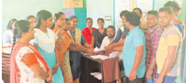
గొలుగొండ, ఏప్రిల్ 8, మేజర్స్: మండలంలోని పాకలపాడు సచివాలయం పరిధిలో గల వాలంటీర్లు అందరూ స్వచ్ఛందంగా రాజీనామా చేయడం జరిగింది. ఈ సందర్భంగా వాలంటీర్లు మాట్లాడుతూ జగన్ ను మళ్ళీ ముఖ్య మంత్రిని చేసుకోవడం కోసం, ప్రజాక్షేత్రంలో స్వచ్ఛంగా తమ వంతుగా ప్రజలం దరికి జగన్, ఎమ్మెల్యే గణేష్ అన్న చేసిన మంచి పనులను ప్రజల వద్దకు నేరుగా తీసుకువెళ్లాలని ఉద్దేశంతో మేముందరం స్వచ్ఛందంగా రాజీనామా చేయాలని నిర్ణయించుకొని రాజీనామా చేసినట్లు వారు తెలిపారు.