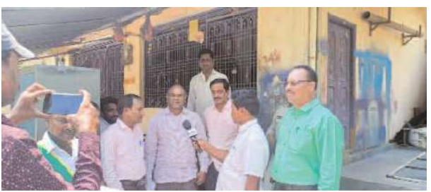
పాల్గొన్నారు ఈ సందర్భంగా జడ్జిగారు మాట్లాడుతూ చిన్నపిల్లలను పనిలో పెట్టుకోవడం చట్టరహితం నేరం కావున దుకాణదారులు ఎవరైనా చిన్న పిల్లలను పనిలో పెట్టుకుంటే చట్టపరమైన చర్యలు తీసుకోవడం కావున చిన్నపిల్లలను ఎవరు పనిలో పెట్టుకోవడం హెచ్చరించారు.