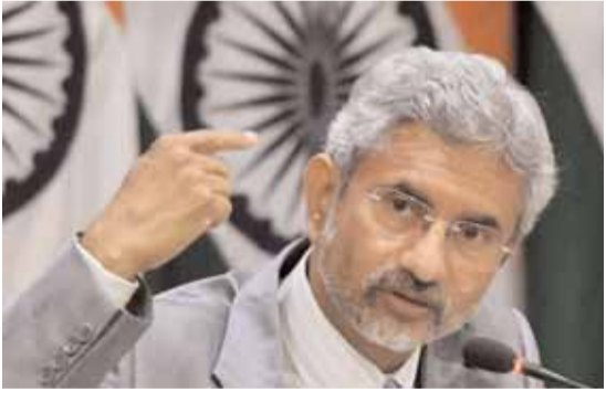
స్వర్ణాభి: భారతదేశాన్ని 'గ్లోబల్ సోల్' వాయిస్తూ అభివృద్ధిచిన విదేశాల మంత్రి డాక్టర్ ఎన్. జైతంకర్, గ్లోబల్ సోల్ దేశాలు తమ కారణాన్ని, ప్రపంచం

అసక్తిని కలిగి ఉందని ఇఎంఐ తెలిపింది. జీ-20 శిఖరాగ్ర సదస్సును గుర్తు చేసి ఆయన, తమ హయాంలో అనేక దేశాలు భారత్ లో అనుసంధానం కావాలని కోరుకున్నారన్నారు. ప్రజలకు అనేక సందోహాలున్నాయి. అయినప్పటికీ జీ20 సదస్సులో వివిధ అంశాలపై భారత్ ఏకాభిప్రాయాన్ని సాధించగలిగిందని ఆయన అన్నారు. తుది నిర్ణయాన్ని మాత్రమే ప్రజలు మార్చారని, కానీ తెలివితేటలు అలా పనులు జరుగుతాయని ఆయన అన్నారు. కోవిడ్ సమయంలో భారత్ పౌరులను తిరిగి తీసుకురావడానికి ప్రధాని మోడీ చేసిన ప్రయత్నాలను, ఉదయోగి మరియు సహాజాన్ సంపర్కంపై హైలైట్ చేస్తూ ప్రధాని 'హామీ' ప్రపంచవ్యాప్తంగా ఉందని విదేశాల మంత్రి జైతంకర్ బ్యాకను ప్రశంసించు భారతదేశాన్ని చేరుకోవడానికి భారతదేశంలో కెన్సెట్ కావడానికి మరియు భారతదేశంలో కలిసి పనిచేయడానికి ప్రపంచం చాలా