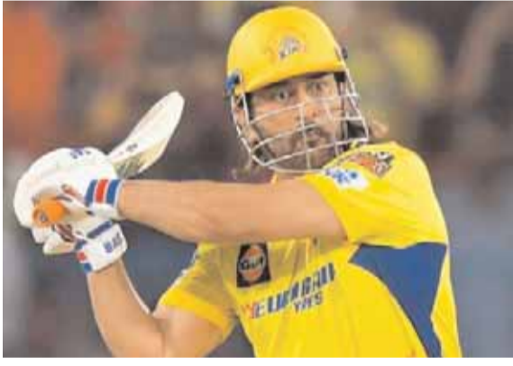
పరుగులు కట్టి చేస్తూనే ఆదిలోనే సర్రెజర్స్ వికెట్ల తీయాలని ధోనీ చేస్తోంది. దాని కోసం తుదిజట్టులో భారీ మార్పులు చేయాలనుకుంటుంది. వికెట్ స్ట్రాక్

గత సీజన్లో సర్రెజర్స్ హైదరాబాద్ మ్యాచ్ అంటే ప్రత్యర్థి జట్టు ప్రత్యేకంగా ప్రణాళికలేమి రచించలేదు. నెట్ రన్ రేటు లంచమేర సంచలనమేర వచ్చిన ఆలోచనలతోనే బరిలోకి దిగారు. కానీ ఐపీఎల్-2024లో అంటే ప్రత్యర్థి వెన్నులో చణుకు వుండాలి. విజయం గురించి ఆలోచించకుండా పరుపు పోకుంటే చాలు అనే రీతిలో ఇతర జట్టు భావించే పరిస్థితి తలెత్తింది. ఎస్ఆర్ఆర్ ఇన్ఫాన్ట్ ప్రత్యర్థి బౌలర్ ఓవర్లు 12 పరుగులు ఇస్తే, అతడు కట్టుదిట్టంగా బౌలింగ్ చేశాడనే మెచ్చు కాసే పరిస్థితి వచ్చింది. హైదరాబాద్ బ్యాటింగ్లో ఓవర్ల కనీసం పది పరుగులు రూపం కాకుండా మారింది. అంతలా మన తెలుగు టీమ్ వెలరేగతోంది. ఆర్సీబికి 11 ఏళ్ల 262 స్కోరు రికార్డును రోజుల వ్యవధిలోనే సర్రెజర్స్ ఏకంగా మూడు సార్లు బ్రేక్ చేసింది. టాప్ స్కోర్ల జట్టుగా పేరు ఉన్న ఆర్సీబికి 287 పరుగుల రికార్డు స్కోరు చేసింది. బలమైన ముంబై ఇండియన్స్ (277 రన్స్) కూడా ఎస్ ఆర్ఆర్ పదిలిపెట్టలేదు. గత మ్యాచ్లో ఢిల్లీ క్యాపిటల్స్ (266 పరుగులు) విరుచుకు పడింది. దీంతో హైదరాబాద్ జట్టులో ఆదివారం చెపాకే చేదికగా జరగనున్న మ్యాచ్ల వెన్నె సూపర్ కింగ్స్ ఇప్పుడే ప్రణాళికలు రచించడం మొదలుపెట్టింది. రికార్డులు సమర్పించుకోకుండా బ్యాట్లను కంట్రోల్ చేయాలని చూస్తోంది.