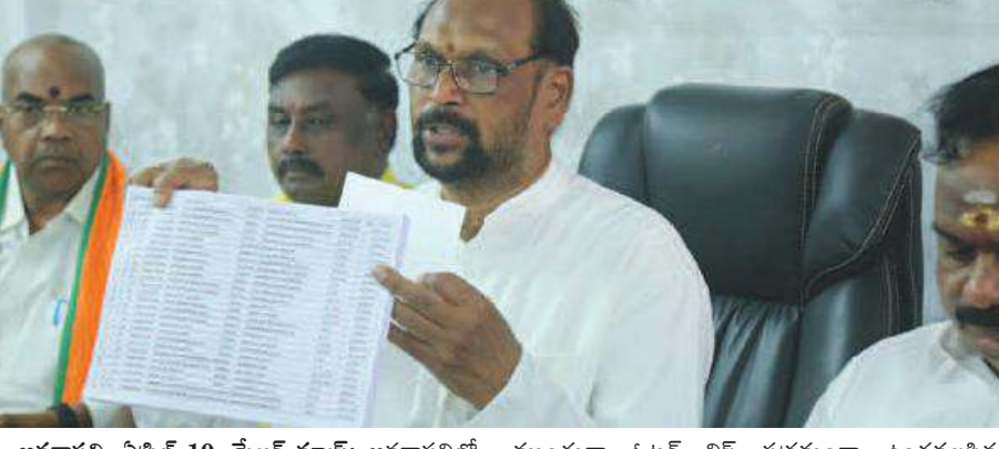
అనకాపల్లి, ఏప్రిల్ 10, మేజర్ స్పాన్సర్: అనకాపల్లిలో బోగన్ ఓట్లపై ఉమ్మడి అభ్యర్థి కొంతమంది రామకృష్ణ ఫైర్ అయ్యారు. స్థానిక పార్టీ కార్యాలయంలో మీడియాతో మాట్లాడుతూ ఇంత పెద్ద దేశంలో ఎలక్షన్ ప్రక్రియ సజావుగా జరగాలని, ఎలక్షన్ సజావుగా జరగాలంటే ముందుగా ఓటర్ లిస్ట్ సక్రమంగా ఉండవలసిన అవసరం ఉంది అన్నారు. గత 35 సంవత్సరాలగా ఎలక్షన్ చూస్తున్నాము కానీ ఎప్పుడూ ఇలాంటి ఓటర్ లిస్ట్ చూడలేదని అన్నారు. ఇప్పుడున్న ఓటర్ లిస్ట్ చూస్తే ఆయామయనీకి గురికావాల్సి మిగతా 2లో