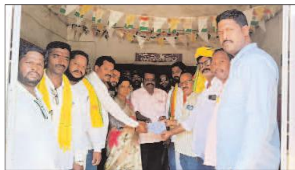
మందస, ఏప్రిల్ 2, మేజర్స్ న్యూస్: శ్రీకాకుళం జిల్లా పలాస నియోజకవర్గం పరిధిలో ఉన్న వృద్ధులు, వికలాంగులు, ఇతర పెన్షన్ లభింపజేయాలకు ఇంటి వద్దే పెన్షన్లు అందించేలా చర్యలు తీసుకోవాలని కోరుతూ టిడిపి నాయకులు పలాస మండల పరిషత్ అధికారికి మంగళవారం వినతిపత్రం అందజేశారు. ఈ సందర్భంగా తెలుగుదేశం పార్టీ ఆయా నాయకులు మాట్లాడుతూ వాలంటీర్లకు బదులుగా ప్రత్యామ్నాయ ఏర్పాట్లు చేయాలని డిమాండ్ చేశారు. ఎన్నికల కోడ్ అమల్లో ఉన్న నేపథ్యంలో నేరుగా సగదు పంపిణీ చేసే కార్యక్రమాల నుండి వాలంటీర్ వ్యవస్థను తప్పిస్తూ ఎన్నికల కమిషన్ ఆదేశాలు జారీ చేసిందని, వారికి ప్రభుత్వం అందించిన సెల్ ఫోన్లు, సిమ్ కార్డులు తక్షణమే స్వాధీనం చేసుకోవాలని ఆదేశించిందని తెలిపారు. ఈ నేపథ్యంలో పెన్షన్ల ను సచివాలయ సిబ్బంది ద్వారా చేయనున్నట్లు ఆదేశాలిచ్చారని, ఆ పెన్షన్లను సచివాలయ సిబ్బంది ద్వారా ఇళ్ల వద్దనే పంపిణీ చేయాలని విజ్ఞప్తి చేశారు. రాష్ట్రంలో ఉన్న సచివాలయ సిబ్బంది, గ్రామ కార్యదర్శుల సేవలను వినియోగించుకుని లబ్ధిదారులకు ఇళ్ల వద్దనే పంపిణీ అందించాలని కోరారు. ఈ కార్యక్రమంలో పిరికట్ల విరల్, కుత్తుం లక్ష్మణరావు, దువ్వాడ సంతోష్, కుత్తుం మాధవరావు, మురిపింటి కుమార్ రాజు, వంకల కూర్మారావు తదితరులు పాల్గొన్నారు.

మండల పరిషత్ అభివృద్ధి అధికారికి టిడిపి నాయకులు వినతి