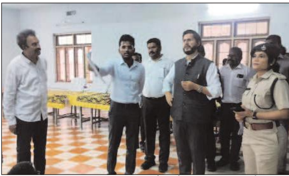
పరంగా అన్ని విధాల భద్రతా చర్యలు తీసుకోవడం, కౌంటింగ్ కేంద్రానికి వచ్చే వాహనాలకు ఎలాంటి ట్రాఫిక్ లేకుండా, సులువుగా చేరుకునేలా జిల్లా ఎన్నికల అధికారితో సమన్వయం చేసుకోవడం లాంటి అంశాలపై వివరించారు. జాయింట్ కలెక్టర్ ఎం సవీన్, జిల్లా రెవెన్యూ అధికారి ఎం గణపతి రావు, శ్రీకాకుళం ఆర్డీవో సిహెచ్ రంగయ్య, ఆర్ అండ్ బి ఎస్ఈ జాన్ సుధాకర్, పలువురు రెవెన్యూ, పోలీస్ సిబ్బంది తదితరులు పరిశీలనకు హాజరయ్యారు.

శ్రీకాకుళం, ఏప్రిల్ 2, మేజర్ న్యూస్: సాధారణ ఎన్నికలు - 2024 కోసం ఎచ్చెర్ల మండలం శివాని ఇంజనీరింగ్ కళాశాలలో ఏర్పాటు చేస్తున్న కౌంటింగ్ కేంద్రం, స్ట్రాంగ్ రూములను జిల్లా కలెక్టర్ మనజీర్ జిలాని సమూన్, జిల్లా ఎస్పీ జి.ఆర్ రాధిక ఇతర ముఖ్య అధికారులతో కలిసి మంగళవారం పరిశీలించారు. ఈవిఎమ్, ఇతర అనుబంధ యూనిట్లు భద్రపరిచే స్ట్రాంగ్ రూమ్ వద్ద కట్టుదిట్టమైన భద్రతతో పాటు, 24 గంటలు కాస్టింగ్ జరిగేలా సీసీ కెమెరాలు కూడా ఏర్పాటు చేసి రక్షణ చర్యలు తీసుకోవాలని ఈ సందర్భంగా కలెక్టర్ ఆదేశించారు. ముందుస్తు ఏర్పాట్ల పట్ల సంతృప్తి వ్యక్తం చేశారు. సులువుగా వాహనాల చేరుకునేలా నిర్మిస్తున్న రహదారి పనులను స్వయంగా పరిశీలించారు. జిల్లాలోని ఎనిమిది అసెంబ్లీ నియోజక వర్గాల నుంచి ఓటింగ్ ప్రక్రియ పూర్తయిన తరువాత కట్టుదిట్టమైన భద్రత మధ్య శివాని కళాశాలలో ఏర్పాటు చేసిన స్ట్రాంగ్ రూమ్ లకు తీసుకొని వస్తారని, రిసల్ట్ కేంద్రం వద్ద ఈవిఎమ్ లను స్వీకరించి, ఒక నిర్దిష్టమైన రూంలో ఆయా నియోజక వర్గాలకి కేటాయించిన స్ట్రాంగ్ రూమ్ లకి తరలించాలి ఉంటుందని స్పష్టం చేశారు. అసెంబ్లీ, పార్లమెంట్ నియోజక వర్గాల వారిగా బ్యాలెట్ యూనిట్ లను రిసెప్షన్ కేంద్రం నుంచి స్ట్రాంగ్ రూం వరకు తీసుకుని వచ్చే సిబ్బందికి ప్రత్యేక డ్రెస్ కలర్ కోడ్ ఇవ్వాలని సూచించారు. జిల్లా ఎస్పీ జి.ఆర్ రాధిక పోలీసు బందోబస్తు