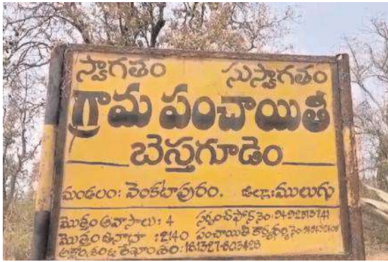
బెస్సు గూడెం గ్రామ శివారులో క్షుద్రపూజలు