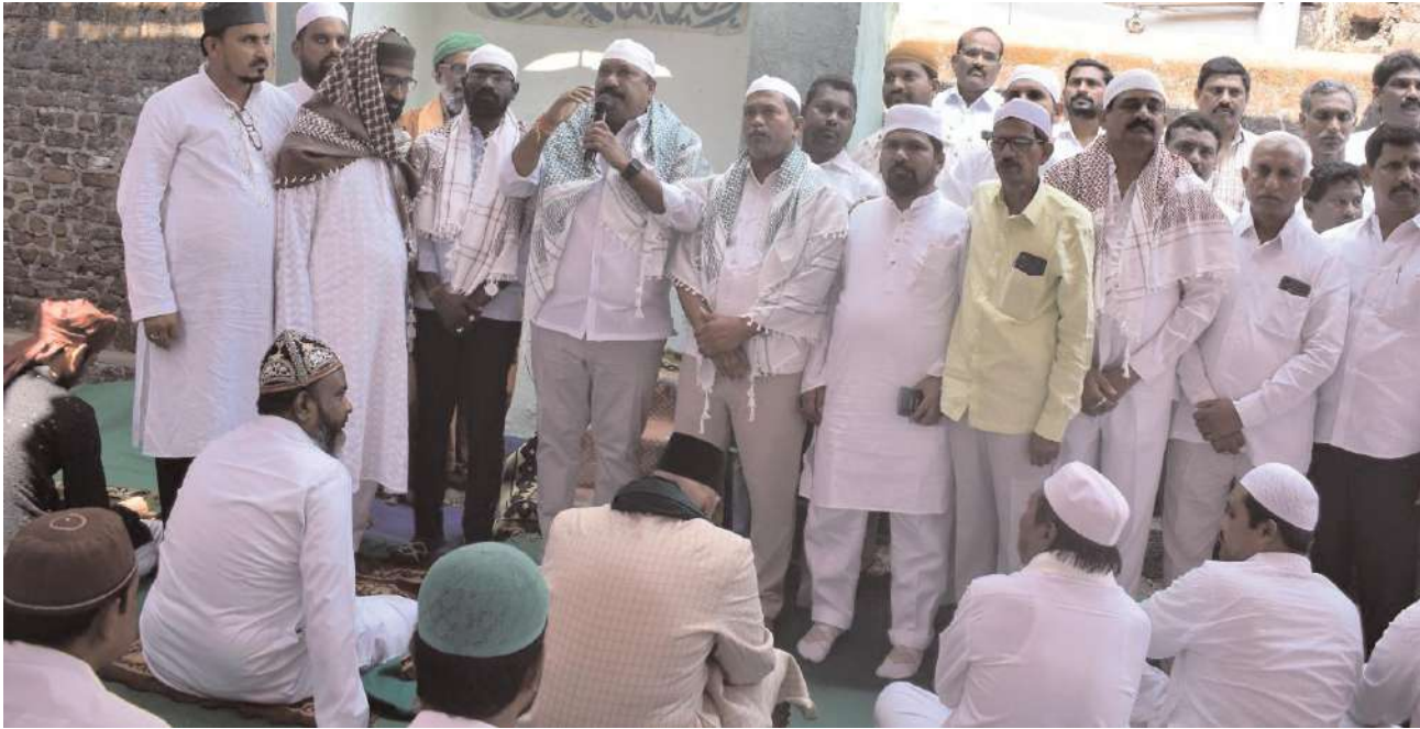
ఈద్గాలో సామూహిక ప్రార్థనలు