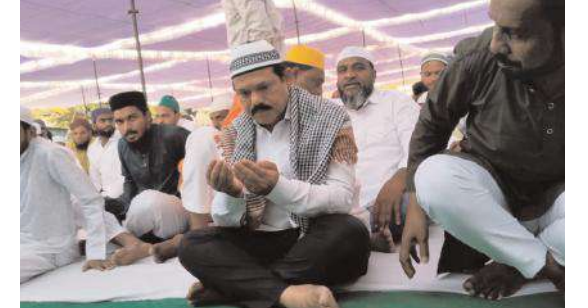
మహబూబాబాద్, రూరల్, ఏప్రిల్ 11,మేజర్ న్యూస్ (సూర్య): మహబూబాబాద్ మున్సిపాలిటీ పట్టణ కేంద్రంలోని ఇంటర్మీడియట్

మహబూబాబాద్ ఎమ్మెల్యే డాక్టర్ భూక్యా మురళి నాయక్