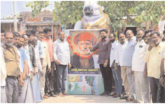
ఘనంగా జ్యోతిరావు పూలే 198వ జయంతి