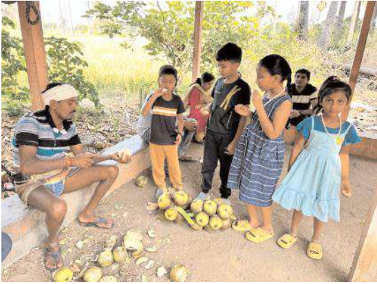
మొదటి పేజీ తరువాయి..

చిన్నారుల నుంచి పెద్దల వరకు ఇష్టంగా తింటారు.