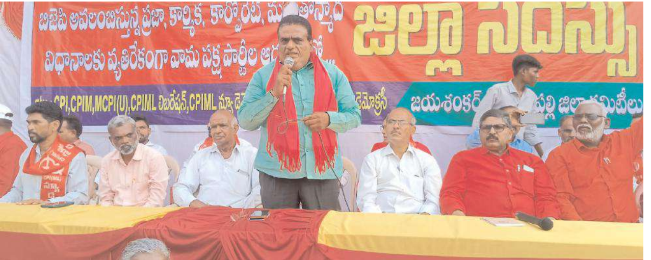
మొదటి పేజీ తరువాయి..