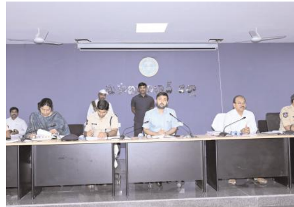
పార్లమెంట్ ఎన్నికలు సజావుగా సాగేలా