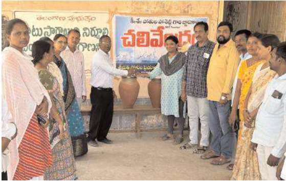
చలివేంద్రం ఏర్పాటు చేయడం అభినందనీయం