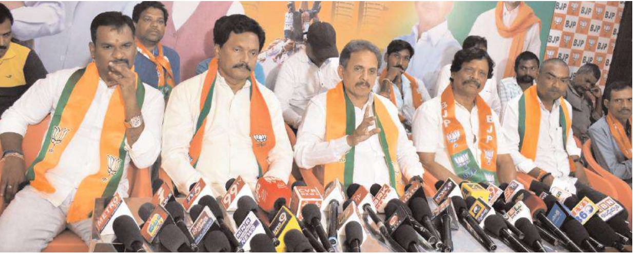
పరకాల నియోజకవర్గంలో 50 వేల మెజార్టీతో బిజెపి గెలుస్తుంది