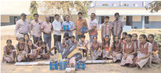
కాటా పూర్ పాఠశాల