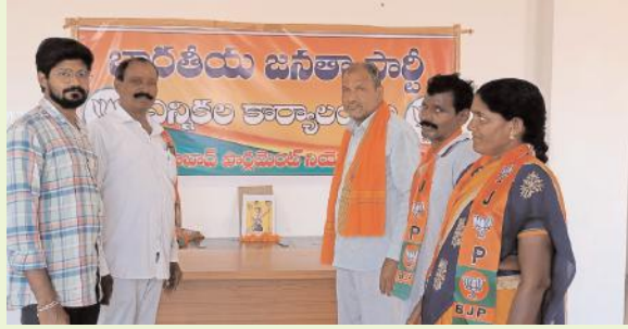
బడుగు బలహీన వర్గాల ఆశాజ్యోతి పోరాటవీరుడు