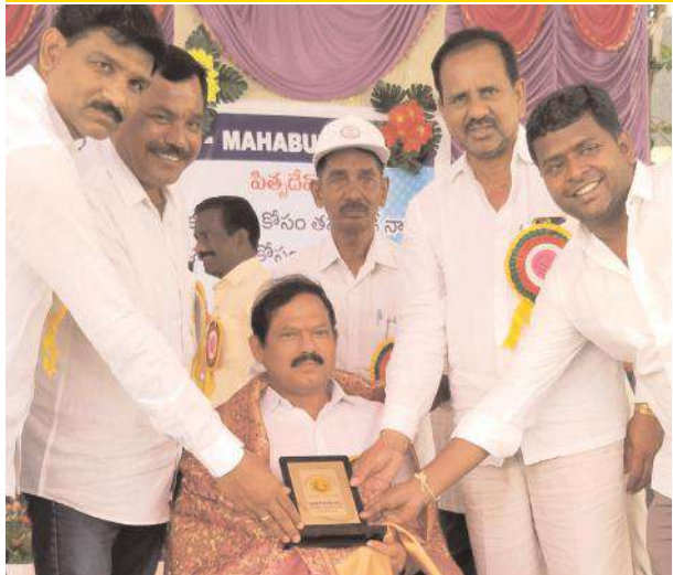
మహబూబాబాద్, రూరల్, ఏప్రిల్ 23, మేజర్ న్యూస్ (సూర్య): మహబూబాబాద్ పట్టణ కేంద్రంలోని నంది నగర్ లోని గీతాంజలి హైస్కూల్లో జరుగుతున్నటువంటి తల్లిదండ్రుల పాదా పూజ కార్యక్రమంలో స్కూల్ యాజమాన్యం యొక్క ఆహ్వానం మేరకు హాజరై జ్యోతి వెలిగించి