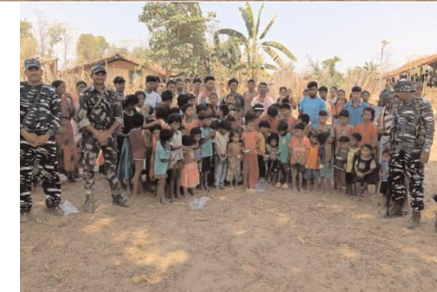
3వేల రూపాయలు ఆర్థిక సహాయం చేశారు. ఈ కార్యక్రమంలో సివిల్, సీఆర్పీఎఫ్ సిబ్బంది పాల్గొన్నారు.