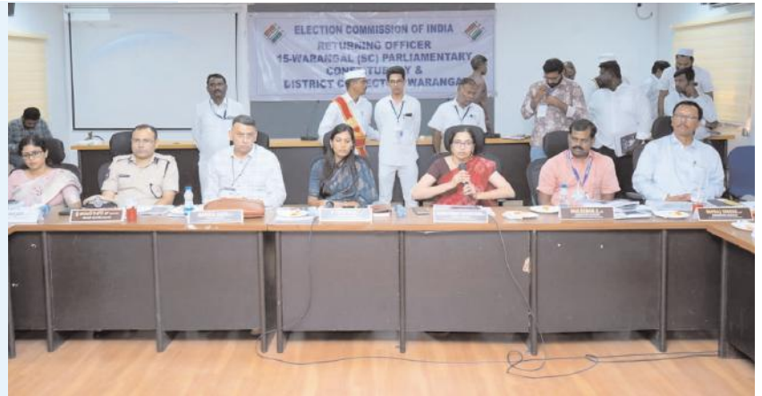
పారపాట్లు జరగకుండా అప్రమత్తంగా ఉండాలన్నారు.