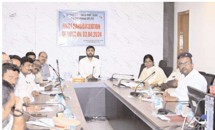
ఎలక్ట్రానిక్ ఓటింగ్ మిషన్ (ఈవీఎం)ల మొదటి విడత