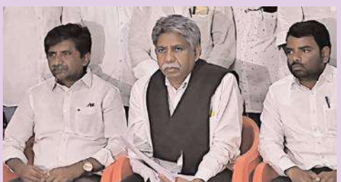
కడియం శ్రీహరి రాజకీయ ప్రస్థానంలో