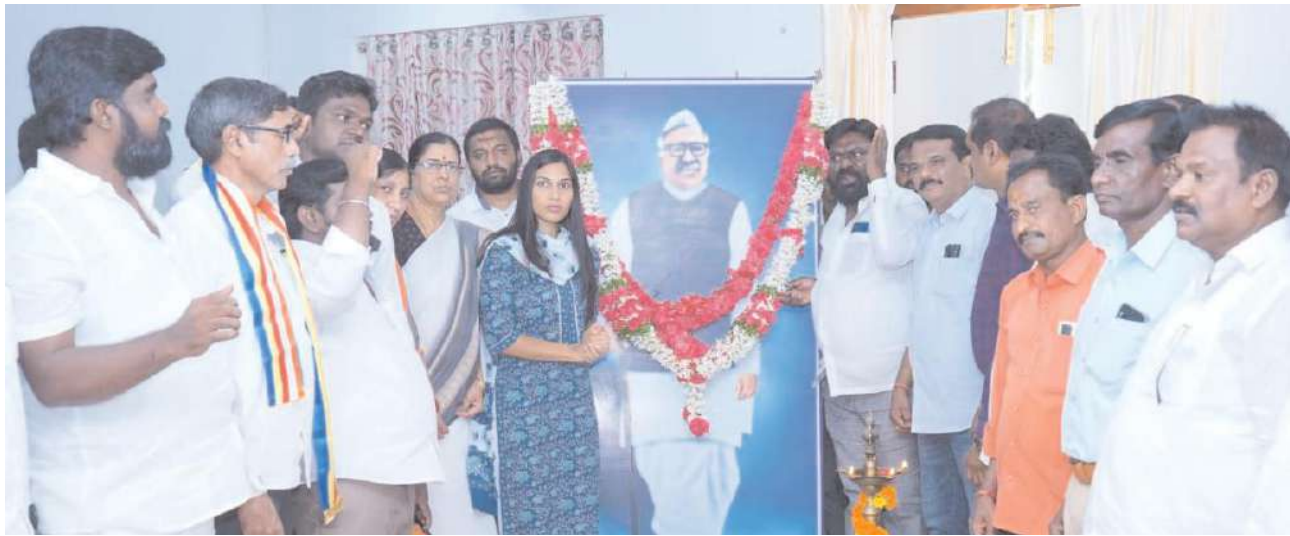
జిల్లా కలెక్టర్ పి. ప్రావీణ్య