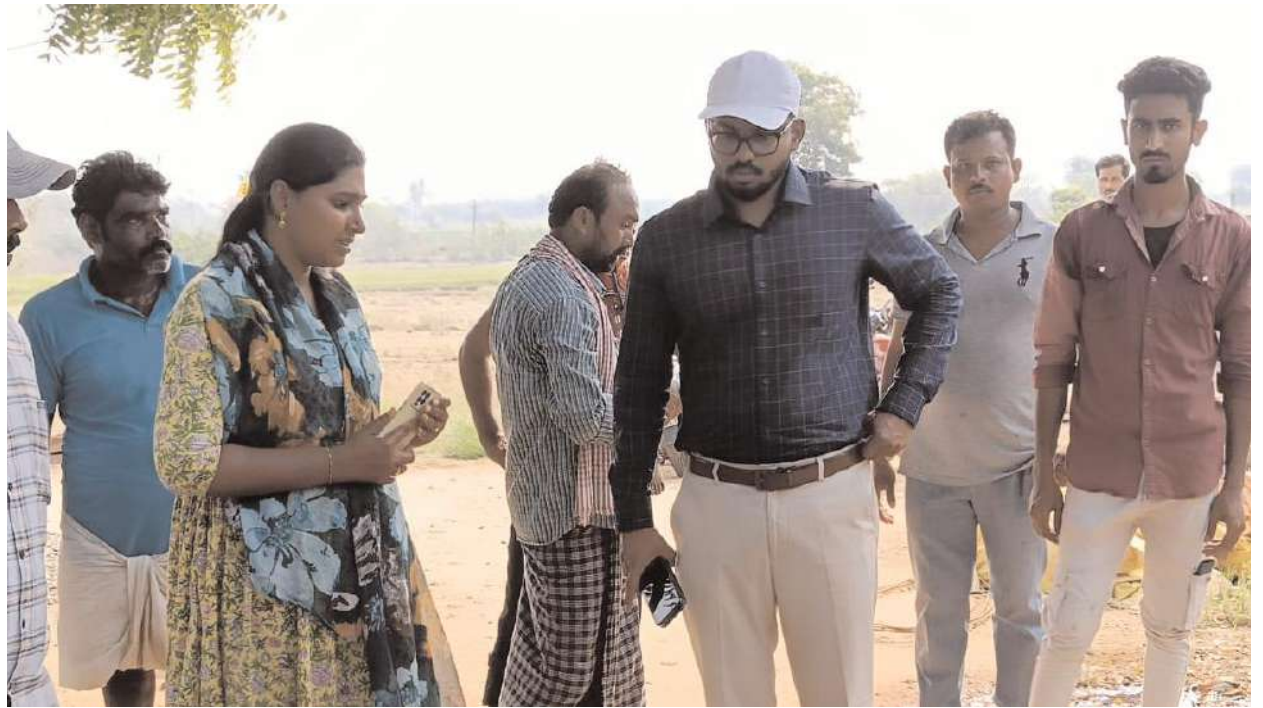
కలెక్టర్ అద్వైత్ కుమార్ సింగ్ ఆదేశాలు జారీ చేశారని అందుకు అనుగుణంగా క్షేత్రస్థాయిలో అధికారులు ఎలాంటి ఇబ్బందులు లేకుండా ప్రత్యామ్నాయ ఏర్పాట్లు చేయాలన్నారు. రిపేరులో ఉన్న మిషన్ భగీరథ