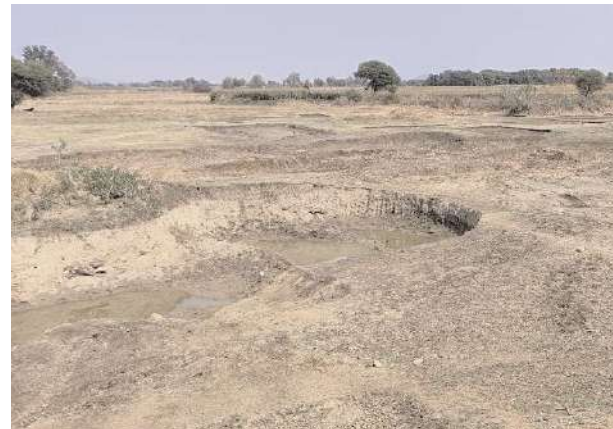
రుక్కమ్మ గుంట చెరువు విస్తీర్ణానికి సంబంధించి ఇచ్చిన రిపోర్టు కూడా వేరే టెన్షన్ లో ఉండి తొమ్మిది ఎకరాల పది గుంటల చెరువును 30 ఎకరాలు ఉన్నట్లు మత్స్య శాఖ జిల్లా అధికారులకు రిపోర్ట్ ఇచ్చానంటూ నిర్లక్ష్యంగా సమాధానం ఇచ్చారు.