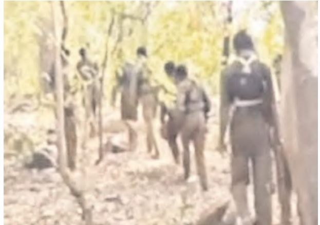
నిర్వహిస్తున్నారు. ఏది ఏమైనా ఈ ఎన్కౌంటర్ తో ఒక్కసారి ఏజెన్సీ గ్రామాలు ఉలిక్కిపడ్డాయి.