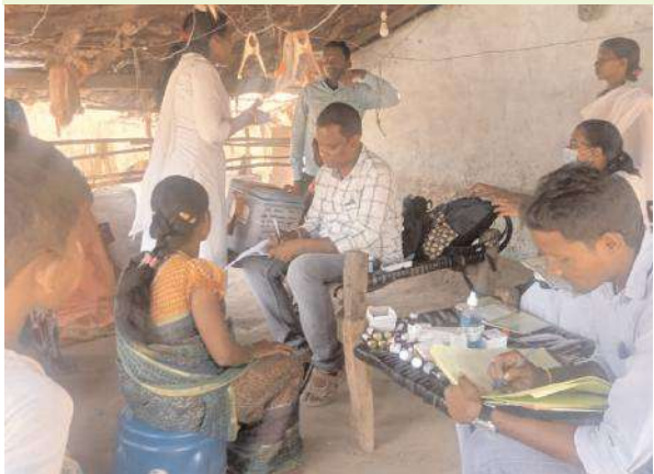
వినియోగించే చెలిమే త్రాగు నీటిని పరీక్షించారు, నీరు స్వచ్ఛమైనప్పటికీ ఆరోగ్య దృష్ట్యా వేడి చేసి చల్లార్చిన నీటిని సేవించాలని సూచించారు. గర్భిణీ

జిల్లా కలెక్టర్ ఇలా త్రిపాఠి గిరిజనులు వడదెబ్బ తగలకుండా జాగ్రత్తలు పాటించాలి గుండెంగవాయి గుత్తి కోయ గిరిజనులకు వైద్య పరీక్షలు నిర్వహించిన వైద్యాధికారులు