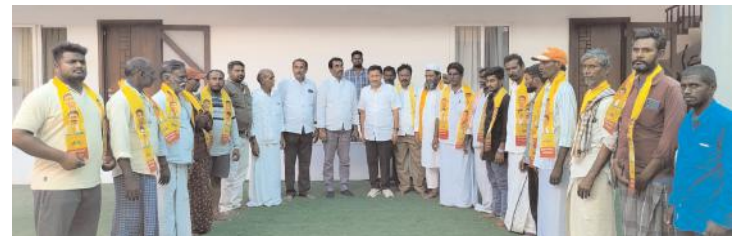
టీడీపీలో చేరుతున్న వైసీపీ నాయకులు