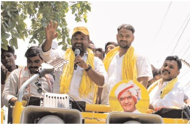
మాట్లాడుతున్న ఎన్ఎండి ఫిరోజ్

- టీడీపీ విజయం తధ్యం - నంద్యాల ప్రజాగళం సభలో ఎన్ఎండి ఘరాక - బైరెడ్డి శబరి