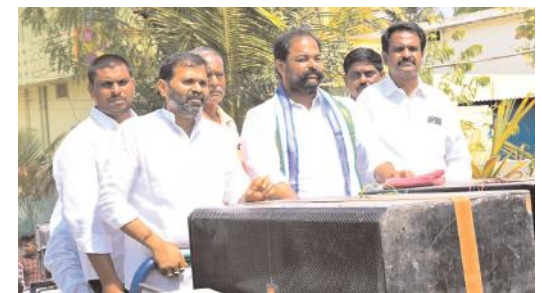
రోడ్డు షో లో పాల్గొన్న దృశ్యం