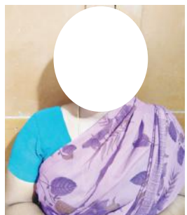
కర్నూల్ క్రైమ్ మేజర్ న్యూస్ : నగరంలోని ప్రభుత్వ