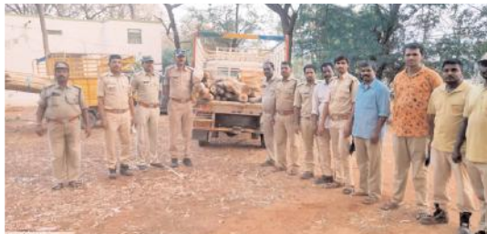
అటవీ అధికారులు స్వాధీనం చేసుకున్న కలప

బండిఆత్మకూరు, రూరల్ మేజర్ న్యూస్ : మండలంలోని