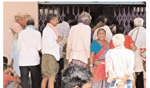
హాళగుండ ఎస్ఐబిబి బ్యాంక్ ముందు వృద్ధులు ఇబ్బందులు