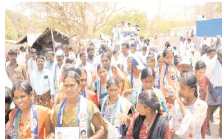
మహిళలతో ర్యాలీగా వెళ్తున్న విరుపాక్షి ప్రచార రథం

పాలు పంచుకుంటానని అన్నారు. గతంలో కొంతమంది పాలకులు డబ్బే ధ్యేయంగా అలూరులో పనిచేశారని నేను డబ్బుకోసం రాలేదని నాకున్న రైల్వే కాంట్రాక్టరు