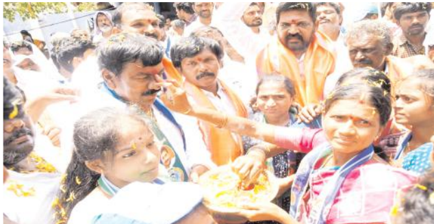
విరుపాక్షికి తిలకం దిద్దుతున్న చెల్లెమ్మ

చంద్రబాబు చంద్రముఖి మాదిరిగా అబద్ధాలతో గెలవాలని చూస్తున్నారని ఆరు పథకాలను ఎలా అమలు చేస్తానో ప్రజలకు చెప్పాల్సిన భాద్యత చంద్రబాబుపై ఉందన్నారు. జగనన్న ను ఎదర్వోవడానికి దుష్టపతుష్టమయులు ఏకమైనా జగనన్న దమ్మున్న నాయకుడు ఒంటరిగా బరిలో దిగుతున్నారని సింహం లా ఎన్నికల్లో నిలబడ్డారని అన్నారు. ఊపిరి ఉన్నంతరవకు మీ కోసం కష్టపడుతామని నా కోసం రాజకీయాల్లోకి రాలేదని మీ బిడ్డగా ఆశీర్వదించాలని విరుపాక్షి ప్రజలను కోరారు. నాకు కుటుంబంతో