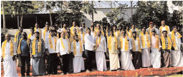
కందువా కప్పి పార్టీలోకి ఆహ్వానిస్తున్న మాజీ ఎమ్మెల్యే బీసీ