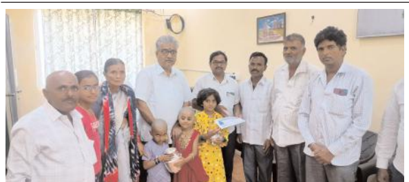
ఆలయ అధికారులకు 750 గ్రాముల వెండి వస్తువులు అందజేస్తున్న భక్తులు

అందించారు. ఈ సందర్భంగా భక్తులు మాట్లాడుతూ స్వామివారి దేవస్థానానికి వెండి వస్తువులను అందించాలని మొక్కుకోవడం జరిగిందన్నారు. ఇందులో భాగంగా అందించామని చెప్పారు. మున్నుండు కూడా స్వామివారి ఆలయ అభివృద్ధికి తమవంతు సహాయ సహకారాలు అందిస్తామని చెప్పారు.