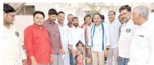
ఫింఛన్ అందిస్తున్న దృశ్యం