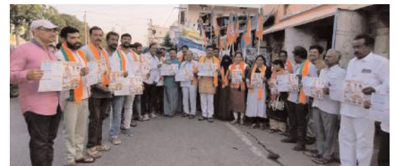
ప్రచారం నిర్వహిస్తున్న దృశ్యం

శ్రీ మహానందీశ్వర స్వామి దేవాలయం, కోటా, ఆత్మకూరు బస్టాండ్, జగజ్జనని నగర్, నడిగడ్డ ప్రాంతాల్లో బీజేపీ శ్రేణులు ఇంటింటికి వెళ్లి కరపత్రాలను పంపిణీ చేశారు. 10 సంవత్సరాల్లో బీజేపీ దేశ, రాష్ట్ర వ్యాప్తంగా చేపట్టిన పథకాలను ప్రతి