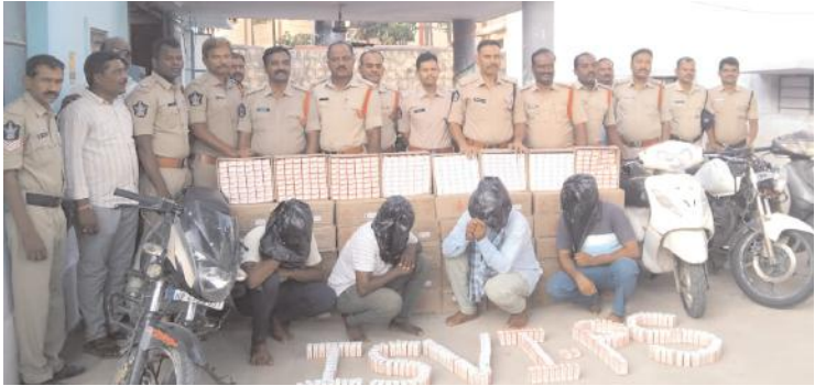
కర్ణాటక మద్యం బాక్సులను చూపుతున్న డిఎస్పీ