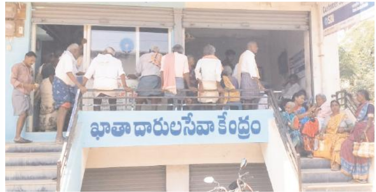
పింఛన్ కోసం ఖాతాదారుల సేవా కేంద్రం వద్ద నిరీక్షిస్తున్న పింఛన్దారులు

వెల్దుర్తి, మేజర్ న్యూస్ నెల 1వ తేదినే ప్రభుత్వ ఉద్యోగుల మాదిరిగానే వారికి జీతాలు ఎలా జమ అవుతున్నాయో అదే విధంగా రాష్ట్రంలోని పింఛన్దారులకు కూడా వాలంటీర్ల ద్వారా పింఛన్ డబ్బులను 1వ తేదినే ఉదయాన్నే ఇంటికి వచ్చి మరీ వాలంటీర్ అందించేవారు. అయితే టిడిపి జాతీయ అధ్యక్షుడు చంద్రబాబునాయుడు వాలంటీర్ల సేవలను నిలిపివేయాలని కోరుతూ కోర్టును ఆశ్రయించడంతో ఒక్కసారిగా కోర్టు వాలంటీర్లు విధులు నిర్వహించకుండా ఉండాలని