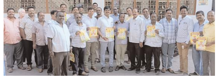
ప్రచారంలో పాల్గొన్న ఆర్యవైశ్య టిడిపి నాయకులు