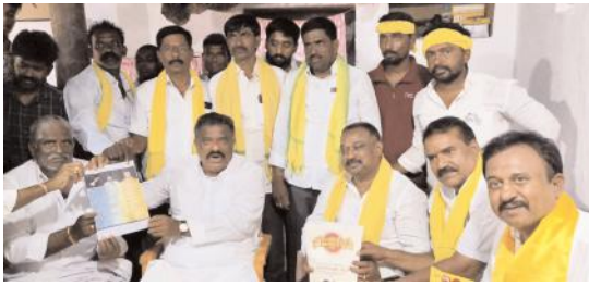
టీడిపి మేనిఫెస్టో కరపత్రాలను ప్రదర్శిస్తున్న కోట్ల, నాయకులు