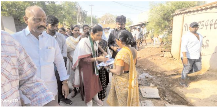
ఫ్యాన్ గుర్తుకు ఓటేయండి...