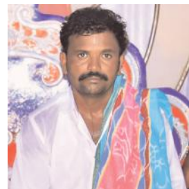
సుంకయ్య (ఫ్రీట్ ఫోటో)