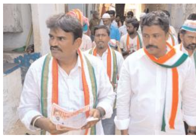
ప్రచారం చేస్తున్న ధృశ్యం

ముఖ్యమంత్రి అయ్యాక నిరుద్యోగుల పరిస్థితి దారుణంగా మారిందని, ఉద్యోగాలు లేక యువత దిక్కుతోచని స్థితిలో ఉన్నారు, ఉద్యోగాలు కల్పించడంలో వైకాపా ప్రభుత్వం ఘోరంగా విఫలమైందని ధ్వజమెత్తారు. పాదయాత్రలో ప్రతి సంవత్సరం జాబ్ క్యాలెండరు వదులుతా అని పలికి,, తీరా ముఖ్యమంత్రి అయ్యాక యువతను నట్టేట ముంచిన ఘనత జగన్ రెడ్డికి దక్కతుందని అన్నారు. ఆంధ్ర ప్రదేశ్ కి పరిశ్రమలు రావాలి అంటేనే భయపడుతున్నాయి ఈ సైకో జగన్ వల్ల, నవ్యాంధ్రప్రదేశ్ చంద్రబాబు పరిశ్రమల ఆంధ్రప్రదేశ్ గా ధృఢ సంకల్పంతో తీర్చిదిద్దితే, రాష్ట్రాన్ని నాలుగున్నరేళ్లలోనే నిరుద్యోగ ఆంధ్రప్రదేశ్ గా తీర్చిదిద్దిన ఘనత జగన్ రెడ్డి కే దక్కతుందని బీసీ ఎద్దేవా చేశారు. యువత ఉద్యోగాలు లేక అవస్థలు పడుతున్నారు. వారికి ఈ ప్రభుత్వం ఉపాధి కల్పించడంలో పూర్తిగా విఫలమైందని విమర్శించారు. తెలుగుదేశం పార్టీ అధికారంలోకి రాగానే యువగళం పథకం ద్వారా ఆంధ్రప్రదేశ్ లోని 20 లక్షల నిరుద్యోగులకు ఉపాధి, మరియు ప్రతి నిరుద్యోగికి 'యువగళం నిధి' కింద నెలకు రూ. 3000 రూపాయలను ఇస్తుందని బీసీ పేర్కొన్నారు. అలాగే చంద్రబాబు ప్రకటించిన సూపర్ సిక్స్ పథకాలను ఇంటింటికి ప్రజలకు వివరించారు.