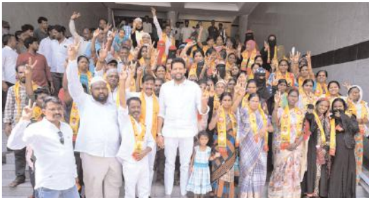
టీడీపీలో చేరుతున్న దృశ్యం