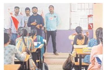
మాట్లాడుతున్న ఏబిఎస్ఎస్ నాయకులు