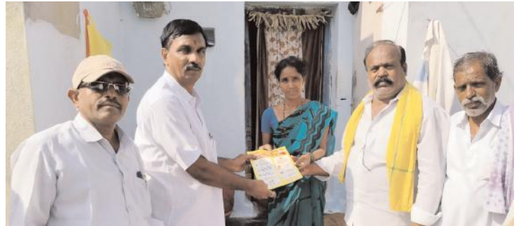
వార్డులో ప్రచారం చేస్తున్న టిడిపి నాయకులు