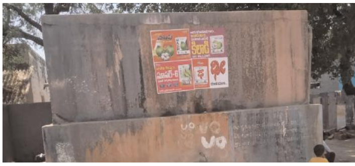
పిల్లిగుండ్ల నిరుపయోగంగా ఉన్న నీటి ట్యాంక్

గోనెగండ్ల, మేజర్ న్యూస్ : మండల పరిధిలోని పిల్లిగుండ్ల గ్రామంలో గత ఐదు రోజులుగా గ్రామానికి తాగునీరు విడుదల కావడం లేదని గ్రామస్థులు తెలిపారు. నీటిని అందించే బోర మోటర్ కాలిపోవడంతో ఈ నీటి సమస్య వచ్చినట్లు తెలిసింది. మండువేసవిలో తాగునీటి సమస్య రావడంతో ప్రజలు ఇబ్బందులు పడుతున్నారు. ఇప్పటికే అధికారులు స్పం దిచాలని ప్రజలు కోరుతున్నారు. ఈ విషయం పై ఆర్డబ్ల్యుఎస్ ఏఈ శ్రీనివాసరెడ్డి మాట్లాడుతూ ప్రత్యేక నీటి ట్యాంకర్ల ద్వారా నీటిని సరఫరా చేసి నీటి సమస్య లేకుండా చూస్తామ దీని తెలిపారు.