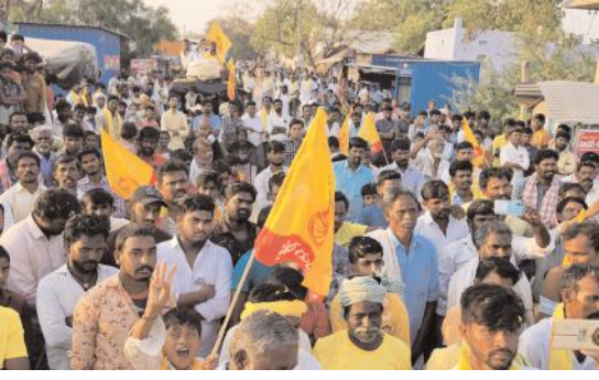
పుట్టపాశం సభకు హాజరైన జనం